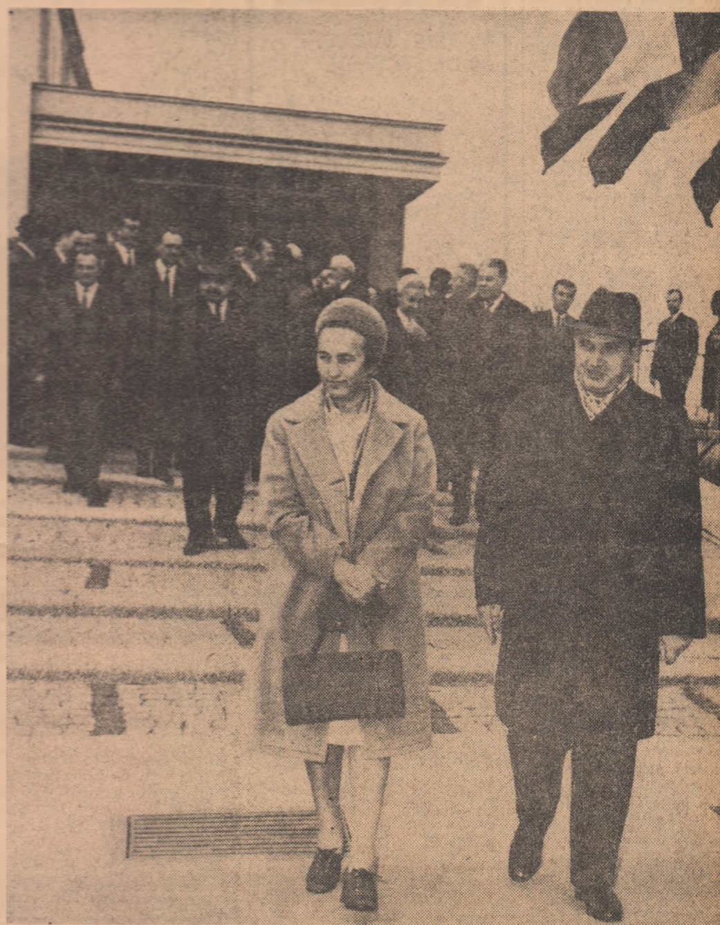
La plecarea pe aeroportul Băneasa