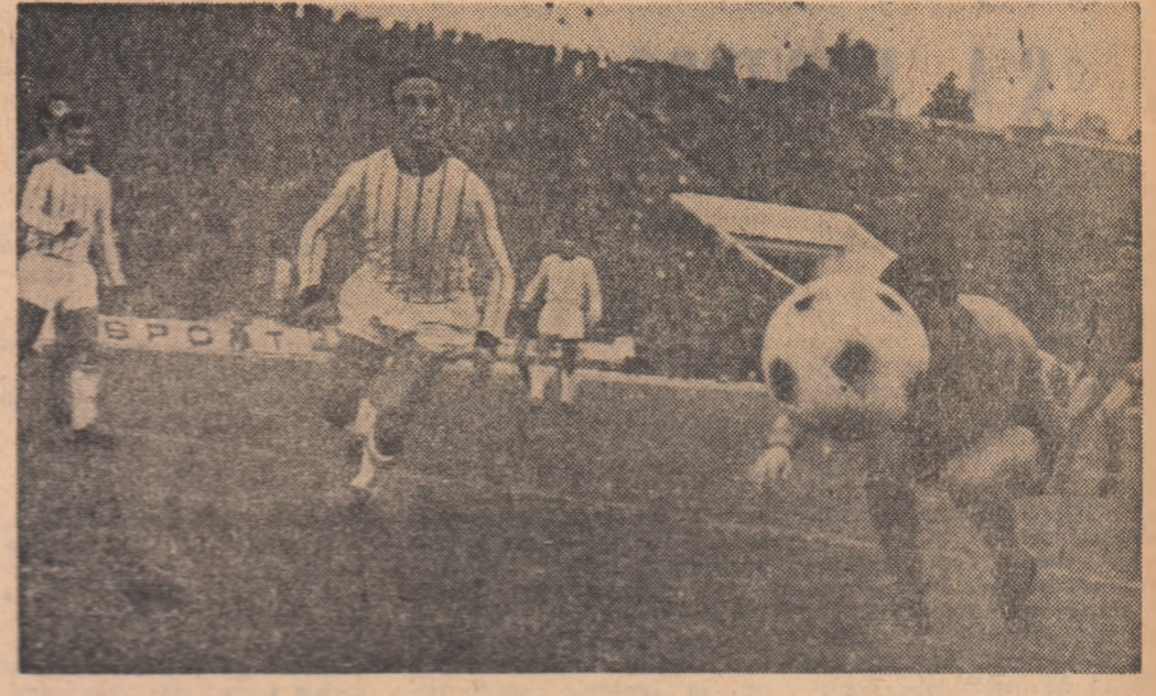
Fază din meciul de fotbal Steaua—Politehnica Iași