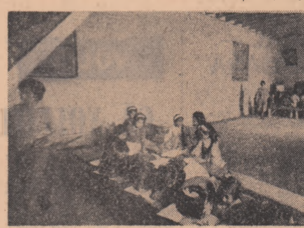
Peisaj școlar obișnuit guatemalez: În chiar capitolul țării, școlarii din două clase învăță, unii stînd direct pe padea, într-o mare magazie care adăpostea pînă de curînd un depozit de produse chimice. „Din 660 de locuiri școlare numai 40 puteau fi considerate proprii cursurilor...”

Alfabetismul constituie, alături de șomaj și subnutriție, una din plâgile cele mai răspândite în Guatemala. Pare curios, faptul că numărul absolut al analfabeților, în loc să scadă manifestă de la un an la altul o tendință de creștere. La recensământul populației analfabete desfășurat în anul 1940 (persoane în vîrstă de peste șapte ani) numărul acestora era de 1.386.000. În 1950 cifra era de aproape două milioane, pentru ca în 1970 să ajungă, așa cum am remarcat, la aproape trei milioane. Analizând acest fenomen, ziarul elvețian NEUE ZÜRCHER ZEITUNG notează, într-o corespondență din Guatemala City că, potrivit aprecierilor forurilor competente „situația deplorabilă în domeniul științei de carte trebuie explicată prin împrejurările economice sociale din centrul urban unde nu se cere decît rar mîna de lucru cu o calificare serioasă și prin actualul sistem cvasistatal de la sate care nu e interesat ca muncitorii agricoli să iasă din ignoranța seculară”.