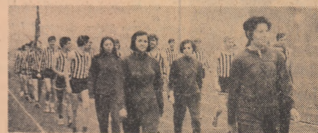
Aspect de la deschiderea anului universitar

• Știri și comentarii din celelalte discipline sportive