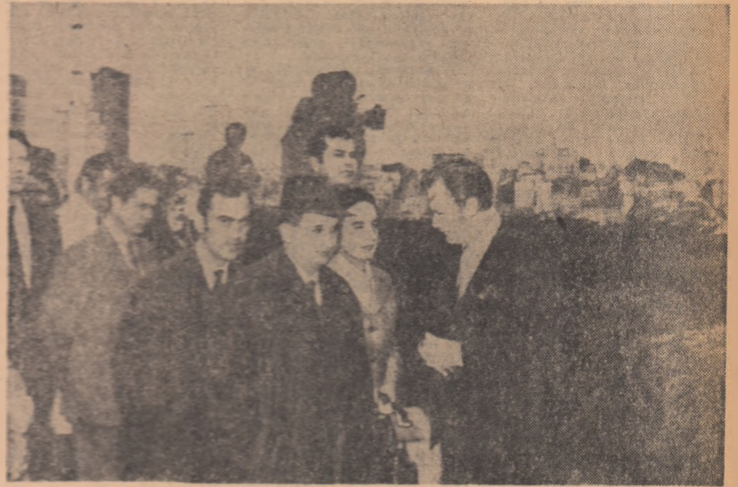
În timpul vizitei în orașul San Francisco