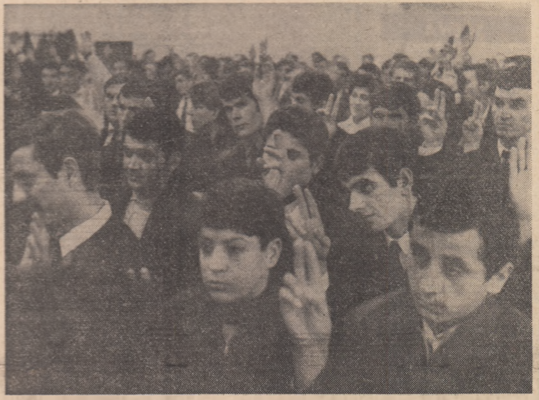
Se votează programul de lucru al organizației.

SĂ DISCUTĂM DESPRE TINEREȚE, EDUCATIE, RĂSPUNDERI