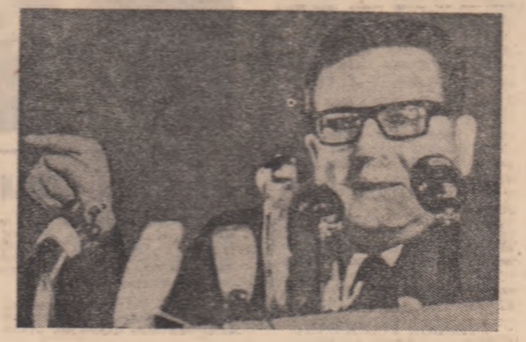
Salvador Allende, vorbind la o întrunire după ce a fost confirmat ca președinte al Republicii Chile

Intr-un comunicat oficial, dat publicității luni seara la Bonn, guvernul federal vest-german a declarat că „manifestația organizată de mișcarea „Acțiunea de rezistență“ și declarațiile acesteia împotriva politicii de reconciliere și destindere sint de natură să aducă grave prejudicii intereselor de stat ale R.F.G. Guvernul federal — subliniază comunicatul — își exprimă convingerea că partidele reprezentante în Bundestag vor lua atitudinea cuvenită față de această manifestare și de organizatorii săi“.