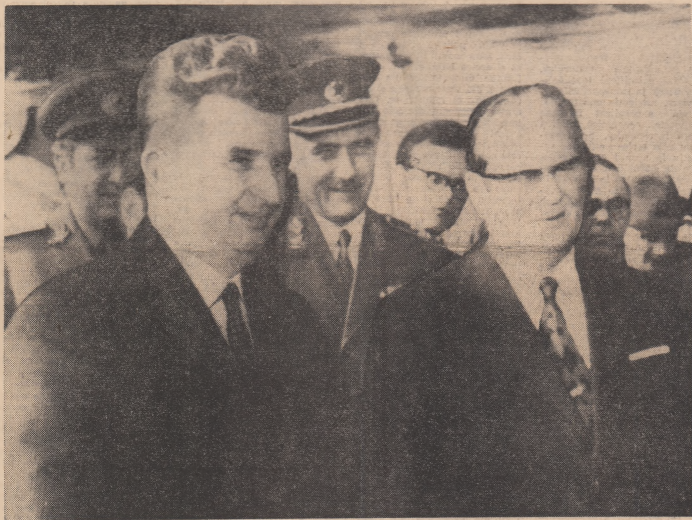
Președintele Nicolae Ceaușescu și președintele Iosip Broz Tito, pe aeroportul orașului Kranj, care a făcut o entuziastă și sărbătorească primire înaltului oaspete român.