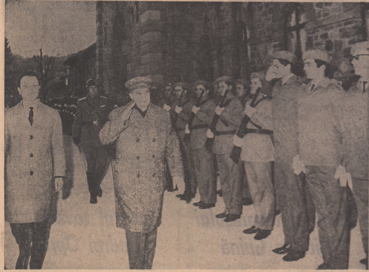
Alături de ostași ai forțelor armate, de membri ai gărzilor patriotice, tinerii din formațiunile de pregătire pentru apărarea patriei prezintă onorul conducătorului răbit al partidului și statului, tovarășul Nicolae Ceaușescu

Într-o atmosferă de emoționantă omagiere a eroismului comunistilor, luptătorii nelnicăți pentru apărarea intereselor poporului muncitor, pentru eliberarea oamenilor muncii de sub jugul exploatării și asupririi, pentru libertatea și independența patriei, mil de cetățeni — muncitori din uzinele ploieștene, din schelele și rafinăriile Văii Prahovei, țărani din împrejurimi, militari, elevi și studenți — s-au adunat ieri spre a comemora treizeci de ani de la prăbușirea, în noaptea de 9—10 noiembrie, a zidurilor închisorii „Doftana”, sub ale cărei dărmtări au fost ucisii numeroși militanți revoluționari.