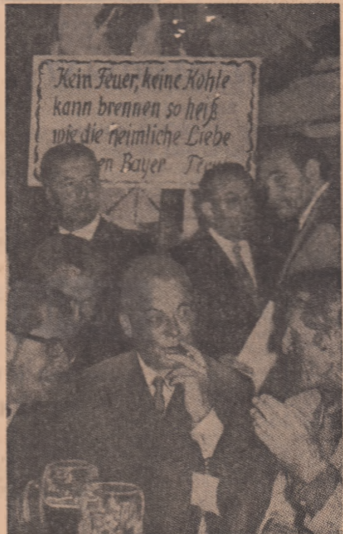
R. F. a GERMANIEI. — Aspect din timpul campaniei electorale din Bavaria : cancelarul Brandt la o întâlnire cu alegătorii