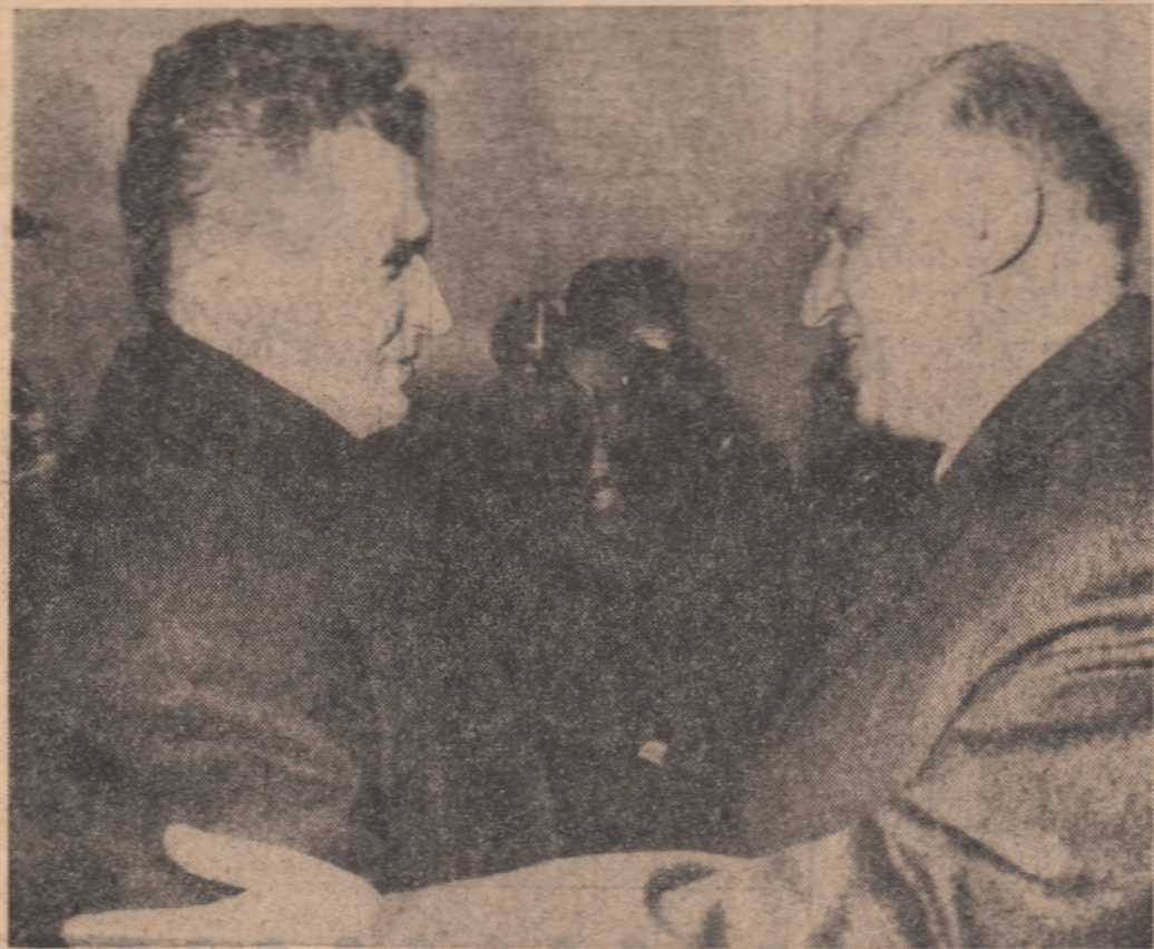
Tovarășii Nicolae Ceaușescu și Todor Jivkov își string călduros mîinile pe aeroportul din Sofia.