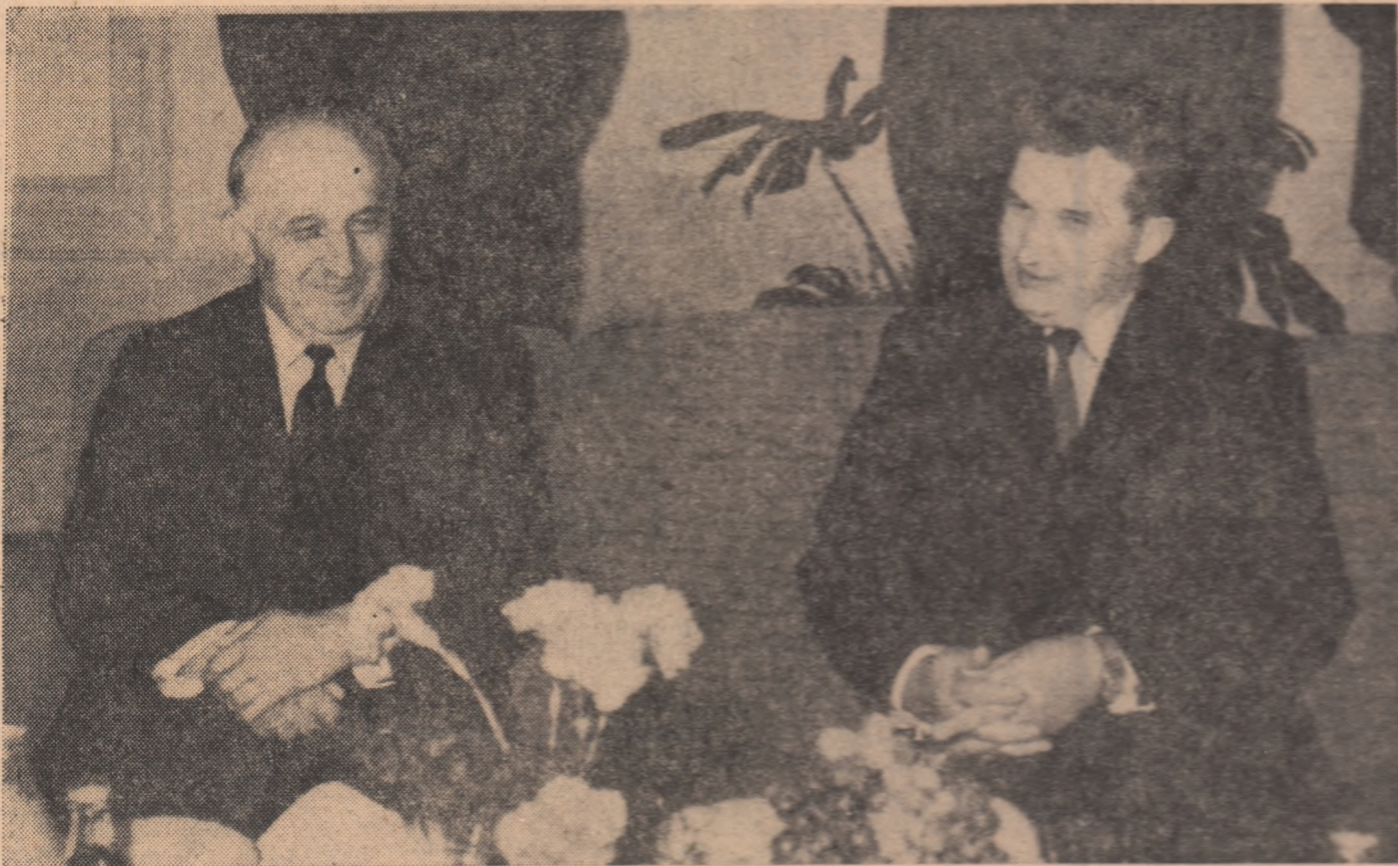
In timpul cizitei protocolare făcută de tovarășul Nicolae Ceaușescu tovarășului Todor Jivkov.