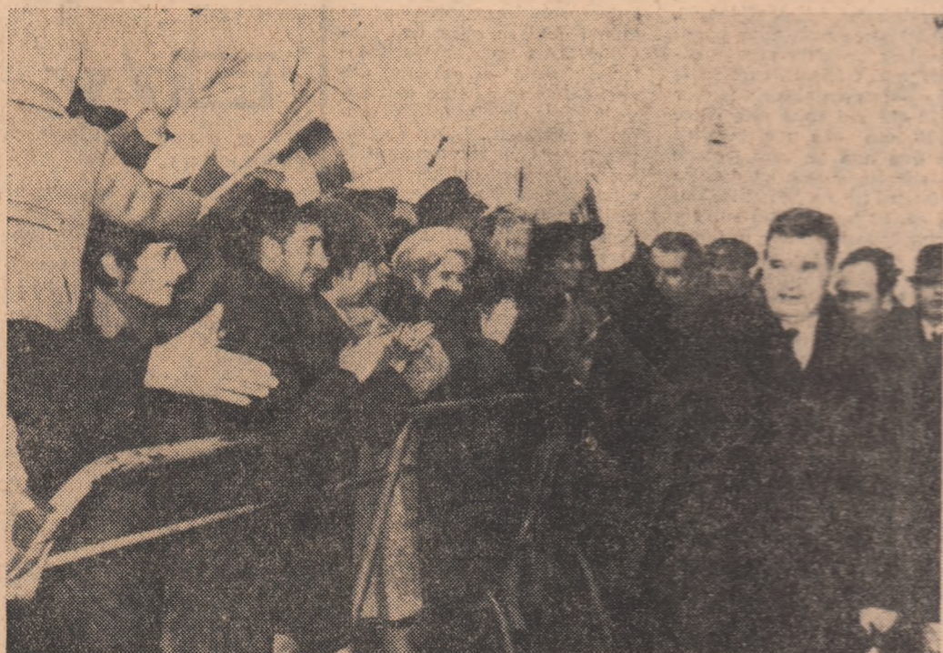
Sofiștii au făcut o călduroasă primire tovarășului Nicolae Ceaușescu.