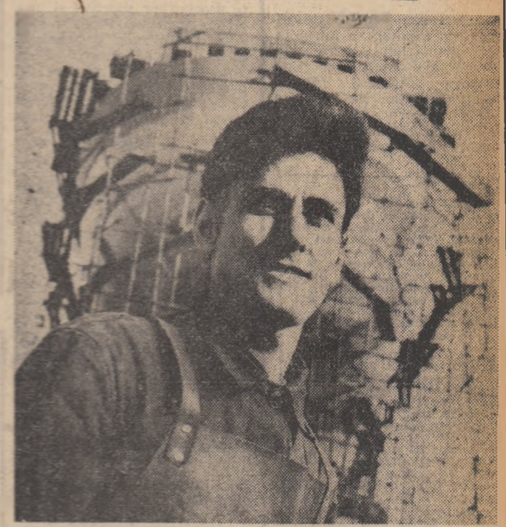
na Gruia de pe malul Dunării, și-a perfecționat an de an măiestria profesională și, în prezent, trece drept unul dintre cei mai buni sudori navali din Turnu-Severin, fiind, în același timp, un bun calch de muncă și un organizator experimentat.