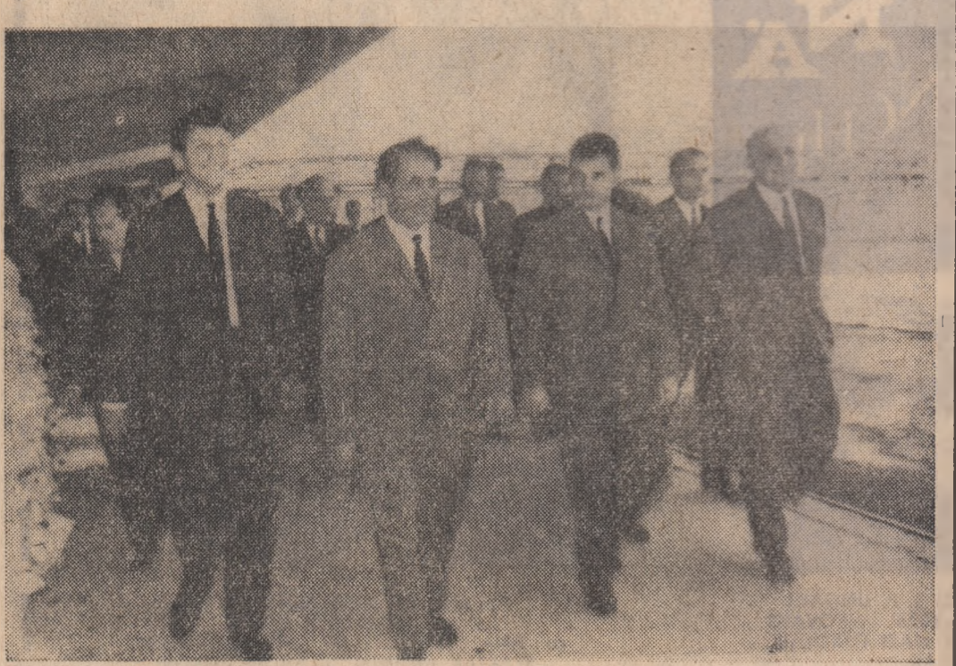
În vizită la Combinatul chimic din Vrața

La invitația Comitetului Central al Partidului Comunist Român, Consiliului de Stat și Consiliului de Miniștri al Republicii Socialiste România, o delegație de partid și de stat a Republicii Democratice Germane, condusă de Walter Ulbricht, prim-secretar al Comitetului Central al Partidului Socialist Unit din Germania, prezedintele Consiliului de Stat al Republicii Democratice Germane, și Willi Stoph, membru