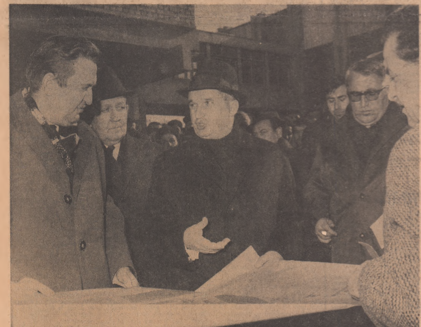
La fabrica de osii și boghiuri din Bals

armonioasă a tuturor zonelor țării, a dus nemijlocit la schimbarea înfățișării Balșului, așezarea modestă de odinioară de pe malurile Olteului — unde nu exista decît o simplă turnătorie de plite pentru sobele de gătit Blocurile de locuințe, clădirea liceului cu 16 săli de clasă, casa de cultură, spitalul, conferă orașului atribuțiile urbanisticii moderne.