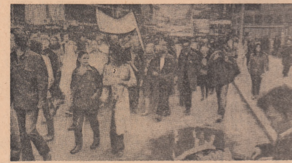
NEW YORK. Demonstrație a tineretului împotriva reacțiilor bombardamente ale aviației militare a S.U.A., asupra R. D. Vietnam.

Ieri, la Cairo, a avut loc prima reuniune a Comitetului su prem de planificare al Uniunii cvadrpartite — R.A.U., Sudan, Elibia și Siria — pentru a studia diferitele etape ale aplicării prevederilor Cartei de la Tripoli, anunță cotidianul egiptean „Al Ahram”.