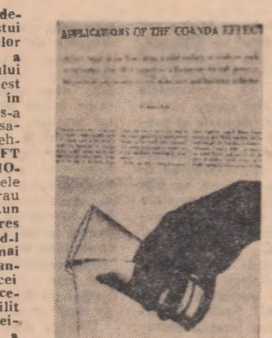
O reproducere din revista „Științific American“ — iunie 1966