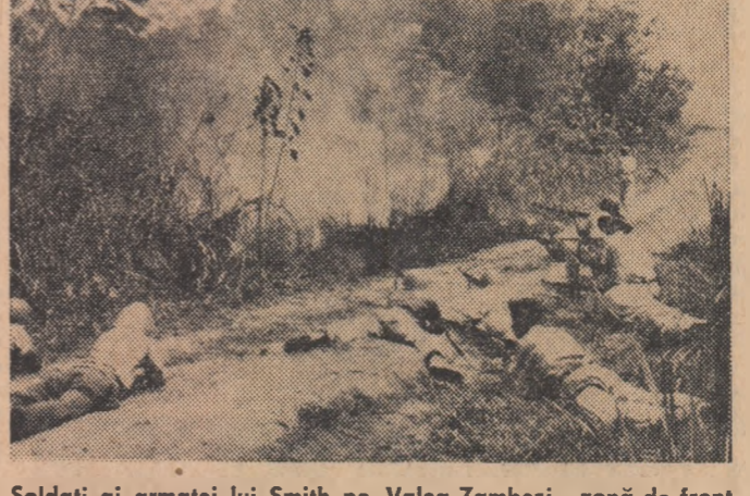
Soldații ai armatei lui Smith pe Valea Zambezi, „zonă de front continuu”.