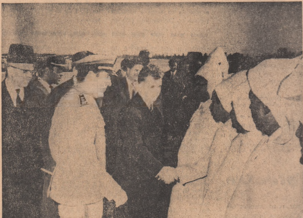
Sosirea la Marrakech

Vizitarea Marrakechului prilejuiește contactul cu unul din cele mai vechi centre ale civilizației maghrebiene. Acest oraș, întemeiat în secolul al XI-lea de dinastia Almora-vidilor, și devenit mai târziu o strălucitoare capitală — tezaur al unor inegalabile ope-