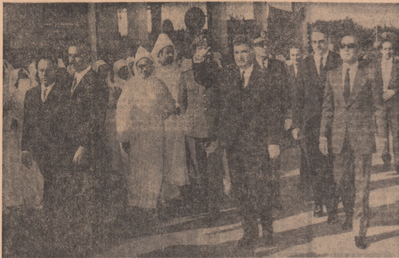
(Urmare din pag. 2)

re arhitectonice — îl primește pe seful statului român într-o atmosferă plină de culoare și pitorească. Încă de la porțile străvechilor ziduri crenelate, care transformă întreaga localitate în decorul unui amplu și extraordinar spectacol folcloric, de-a lungul soselei Sistra, a străzilor orașului străbătute de convoiul oficial, se însușește de muzică arabă, grupuri de dansatori.