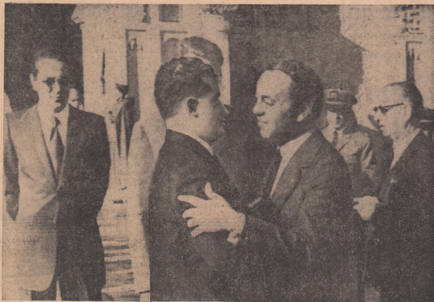
Cei doi șefi de stat își iau rămas bun

Evenimentul de miercuri seara, ale cărui ecouri se fac în continuare puternic simțite, cînd pentru prima oară un șef de stat străin a fost invitat să ia cîștigul în fața Camerei Reprezentanților a Marocului, atestă, o dată în plus, de cîtă prețuire a fost înconjurat conducătorul Republicii Socialiste România. „Nu știm dacă aplauzele repetate ale întregii asistențe au reușit să oglindescă pe deplin ceea ce am gîndit și simțit în aceste clipe — acea puternică emoție de a descoperi că un stat, de care ne despărțea geografic citeva mii de km., se