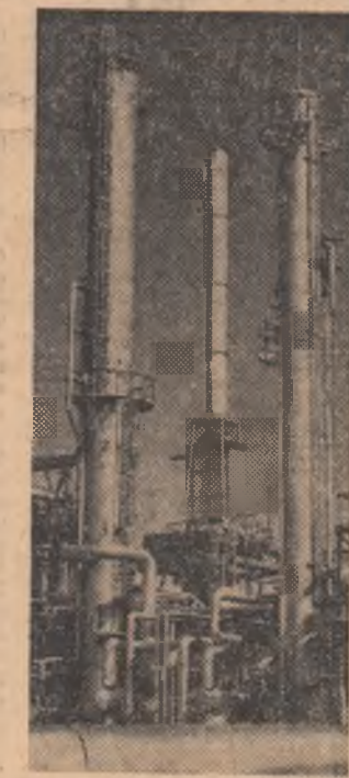
Combinatul de cauciuc sintetic și produse petrochimice din orașul Cheorghiu-Dei dispune de o modernă instalație de dezalchilare a toluenului.