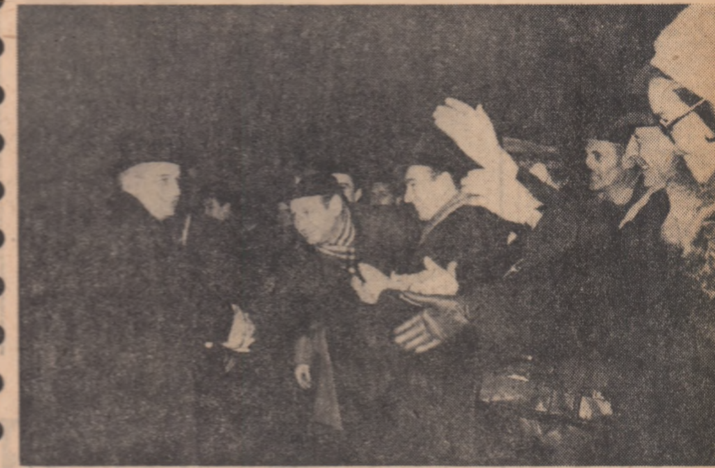
La sosirea în Capitală