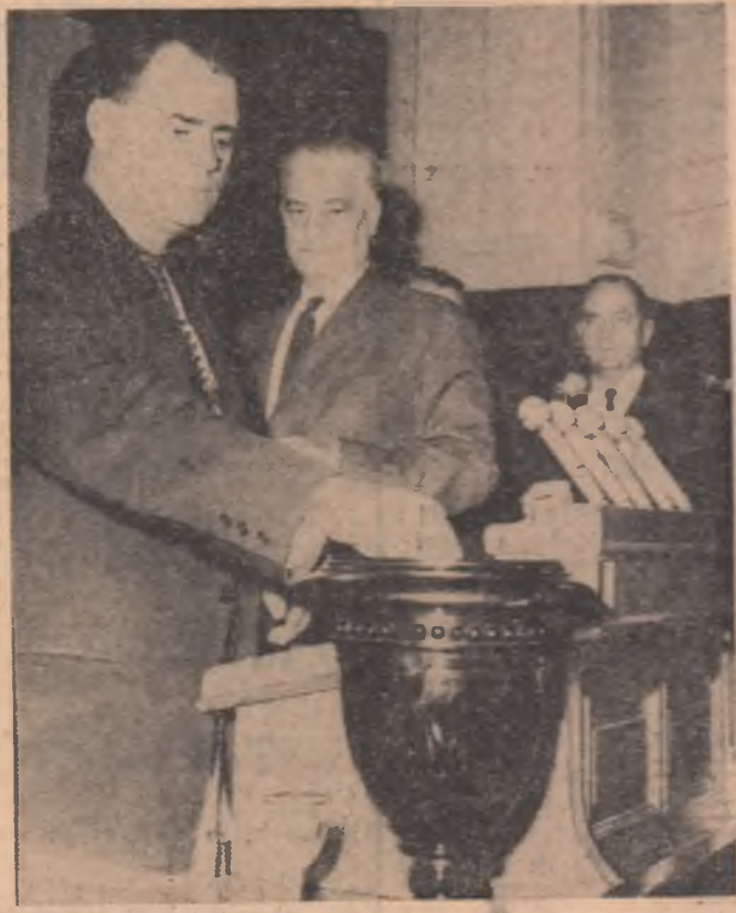
Aspect din timpul lucrărilor Sesiunii Marii Adunări Naționale.