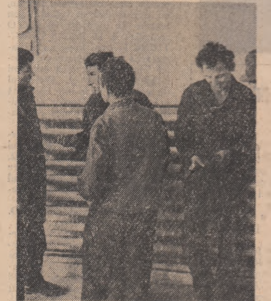
În vreme ce în secțiile uzinei majoritatea tinerilor își văd conștiința de treabă cei trei discută dacă aluminiul se sudează sau nu cu alamă... Iată întreabarea.

● IN RINDUL întreprinderilor din județul Constanța care au anunțat îndeplinirea înainte de termen a planului anual de producție s-a înscris și Uzina de superfosfați și acid sulfuric din Năvodari. Colectivul acestei unități s-a angajat să realizeze, până la sfîrșitul anului, o producție suplimentară de peste 1.500 tone de îngrășăminte fosfatice. Au mai anunțat îndeplinirea, înainte de termen, a planului anual întreprinderile de prelucrare a lemnului din Constanța, Trulșul sanitiereilor de construcții turistice „Litoral” și alte unități economice din județ.