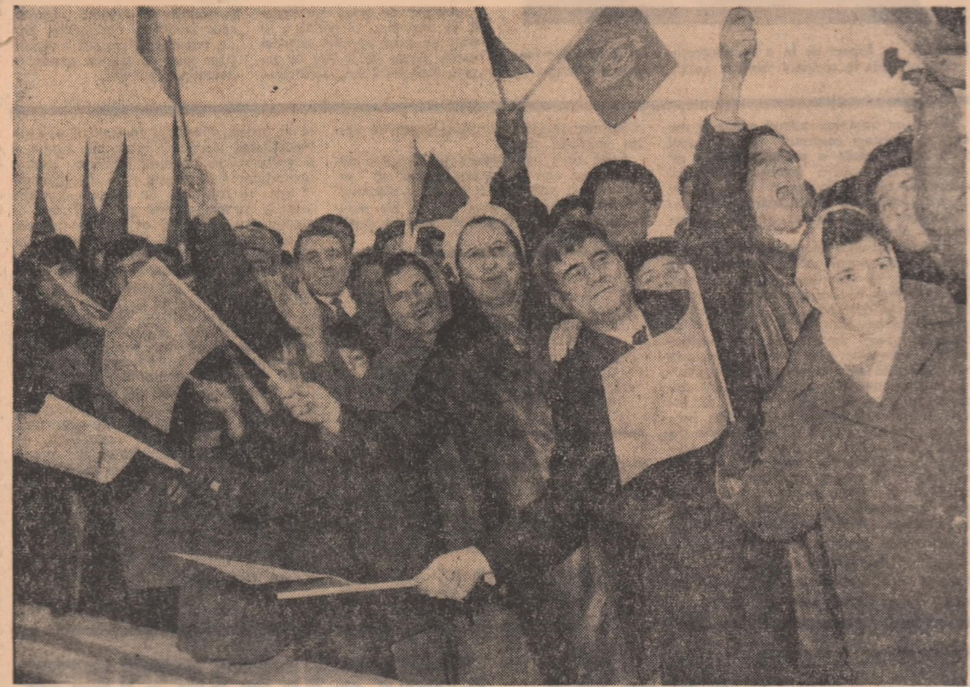
(Urmasor din pag. 1)

tru pietoni de pe ambele laturi ale podului. Noul pod rutier are cinci deschideri (trei de câte 160 metri și două de câte 120 metri), iar viaductele au deschideri de până la 50 metri. Ele dau posibilitatea desfășurării în bune condiții a navigației tuturor tipurilor de nave fluviale și totodată scurgerii stiourilor de gheață în timpul iernii.