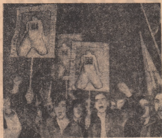
FRANȚA. — Aspect de la o demonstrație care a avut loc recent la Paris în sprijinul tinerilor basci judecați la Burgos

Nu vor beneficia de aplicarea acestui decret deținuții politici împotriva cărora s-au pronunțat verdicte de către diversele tribunale. Printre aceștia se află un număr de aproximativ 200 de membri ai organizațiilor de genuri urbane, cunoscuți sub denumirea de „Tupamaros”. Decretul privind amnistierea deținuților politici a fost precedat de o largă campanie națională vizând anularea așa-numitelor „măsuri prompte de securitate”.