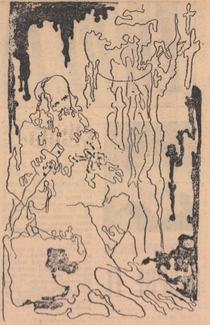
Ilustrație la „Judele de poveste” de Lucian Blaga.