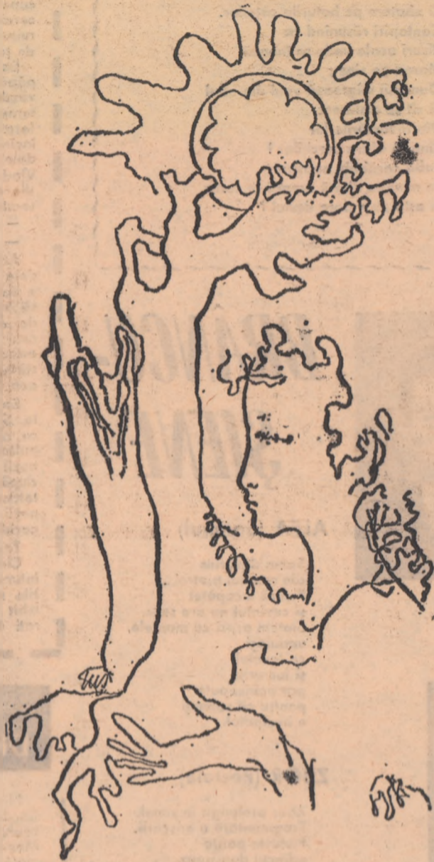
Ilustrație la volumul „Un pămînt numit România” de Nichita Stănescu.

CONSTANTIN CRINGANU Liceul nr. 2 — Birlad