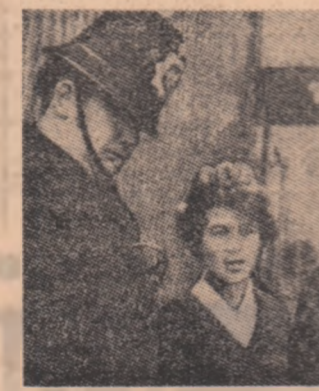
ENGLIA. — Fostul președinte al Federației studenților socialiști din R. F. Germaniei (S.D.S.), Rudi Dutschke, împreună cu soția, după mersul în legătură cu cererea sa de a i se permite rămânerea în continuare în Marea Britanie

Referindu-se la lucrările Conferinței de la Paris în problema Vietnamului, Vo Nguyen Giap a spus: „Dacă guvernul american doră să adevărat să reglementeze pașnic problema vietnameză, el trebuie să pună capăt tuturor actelor de război împotriva R. D. Vietnam, să pună capăt politicii de „vietnamizare” a războiului, să-și retragă total și necondiționat trupele din Vietnamul de sud, lăsând populația de aici să-și reglementeze singură treburile interne”.