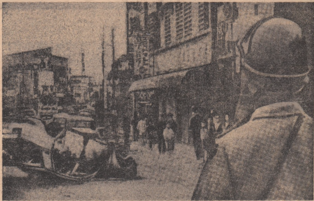
În Okinawa, în orașul Koza, au avut loc recent manifestații împotriva prezenței pe această insulă a bazelor militare americane. Cu acest prilej automobile, aparținînd trupelor americane, au fost incendiate și răsturnate.

Agencia Prensa Latina relevă că în capitala țării numeroși militari însoțiți de gărzi civile patrulează pe principalele străzi, pentru a se preveni posibilele acțiuni ale grupurilor de dreapta.