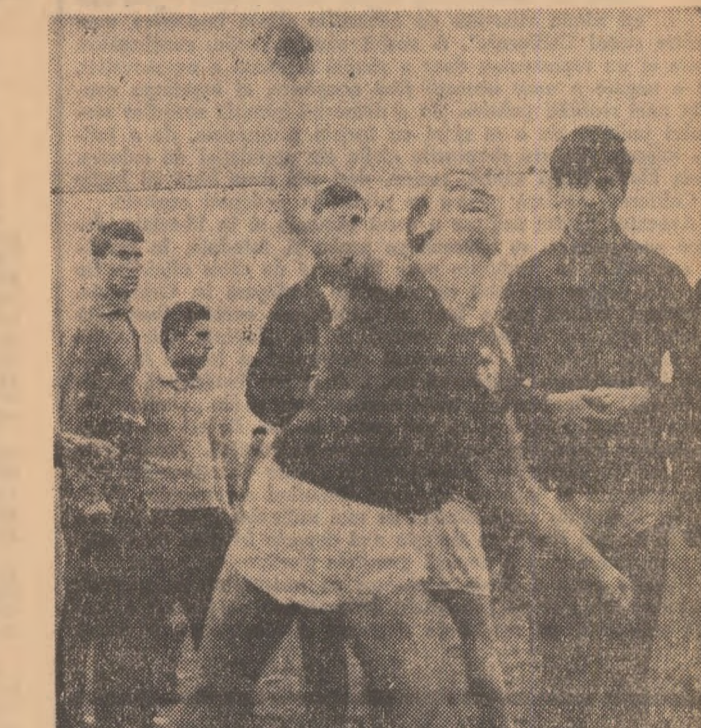
făcut — din partea Ministerului Învățămîntului — o repartitie necorespunzătoare, mai mult simbolică, a fondurilor destinate sportului: în cele 29.500.000 lei afectate dezvoltării sportului în anul 1970, doar 500.000 lei au fost alocați pentru activitatea de masă, suma care, raportată la numărul studenților țării care au dreptul să beneficieze de aceste avantaje, ne arată că revin mai puțin de 5 lei pentru fiecare student. Dar și aceste fonduri s-au folosit nu pentru extinderea spațiilor, amenajări și dotări, ci pentru susținerea activităților competiționale din centrele universitare. De altfel, este concludent faptul că din cele 115 noi terenuri planificate și amenajate și date în folosință în 1968—1970, nu s-au realizat decît 35. Se continuă, nejustificat, construirea și lărgirea complexelor studențești fără un minimum de amenajări sportive, după cum însuși ministerul cedează cu ușurință baze sportive (cele Carpați și stadionul Medicină din București — spre exemplu) fără a face efortul de a le înlocui, și fără a preținde, așa cum prevede legea, să primească spații corespunzătoare în locul celor cedate.

dar după etapele pe facultăți în-țră în joc sportiv de performanță și, de aci înainte, intervin interesele cluburilor care preiau, alături de catedre și organiza-re. E un paradox care trebuie înțeles. În acest sens scoțese că formula asociațiilor sportive ale studenților ar fi o soluție care să elimine echivocul și a-runcarea răspunderii de pe un factor pe altul.