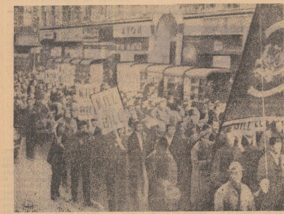
ANGLIA. Unul din semnele opoziției crescînde împotriva legii antisindicale a guvernului englez: demonstrația a muncitorilor din industria de automobile din Birmingham.