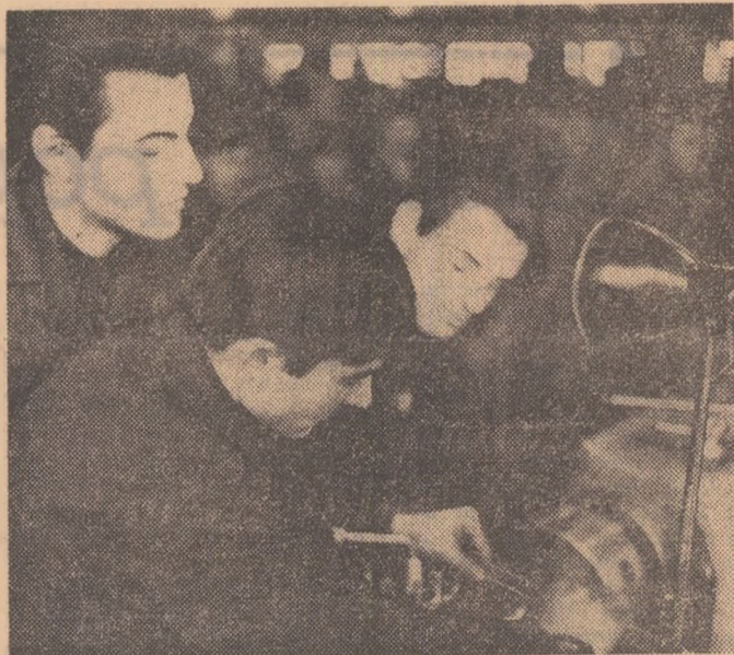
Încă din primele zile ale anului tinerii strungari de la Uzina de utilaj și piese de schimb — Suceava au obținut noi succese la producția de unicat și serie mică