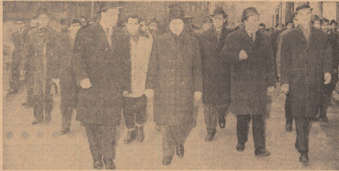
În incinta uzinei de utilaj chimic Ploiești.

Marți, 12 ianuarie, tovarășul Nicolae Ceaușescu împreună cu tovarășii Gheorghe Pană, Maxim Berghianu, Manea Mănescu, Petre Blajovici și Vasile Patilineț, s-a întîlnit din nou cu factorii de conducere și colectivele de salariați, la locul lor de producție, la Uzina de mecanică fină din Sinaia, Uzina mecanică „Neptun”, Întreprinderea pentru reparații de utilaj electric (I.R.U.E.) și Uzina mecanică din Cimpina, Uzina mecanică-Plopeni, Uzina de utilaj chimic și Uzina „1 Mai” din Ploiești.