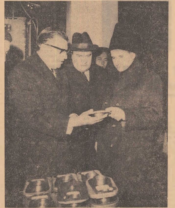
La Uzina de mecanică fină din Sinaia, tovarășul Nicolae Ceaușescu primește explicații cu privire la tehnologia de fabricație a produselor întreprinderii.

O oprire la locul de muncă al maistrului Vasile E-nache prilejuește un alt dialog între secretarul general al partidului și muncitorii adunați în jurul său despre felul în care muncitorii își îndeplinesc sarcinile de producție, despre condițiile lor de muncă și de viață. Gazdele informează pe oaspeți că an de an întreprinderea a fost întregită cu noi suprafețe de producție, printre care : o hală modernă de montaj și tratament termic, o hală de prelucrări mecanice, iar în prezent se află în construcție o hală industrială, care, împreună cu alte măsuri tehnico-organizatorice, va spori producția uzinei în actualul cincinal de aproape cinci ori. Dezvoltarea uzinei, arată secretarul general al partidului, poate cunoaște un ritm mai accentuat și recomandă conducerii ministerului de resort, colectivului de conducere al întreprinderii să acorde în continuare o atenție sporită acestei unități. Aici, la Cîmpina — precizează tovarășul Nicolae Ceaușescu — sînt muncitori cu o bogată experiență, cu o vechi tradiție, potențial ce se cere valorificat pe trepte mai înalte. Luîndu-se în discuție necesitățile pe ansamblu ale industriei metalurgice și constructoare de mașini din Cîmpina, se emite ideea construirii unei turnătorii unice cu o capacitate de 35 000 tone, realizabilă prin colaborarea tuturor beneficiarilor. Un fapt deosebit de semnificativ: tînarul inginer Gheorghe Miloiu, care după 9 ani