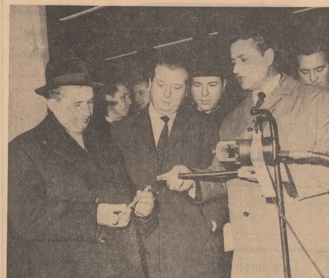
AUTOMATICA — Oaspeților li sînt prezentate prototipurile citorca instalată asimilate de întreprindere.

Indicațiile secretarului general al partidului constituie pentru colectivul întreprinderii