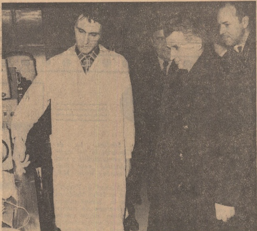
FABRICA DE ELEMENTE DE AUTOMATIZARE — vizita a prilejuit și aici un dialog de lucru fructuos