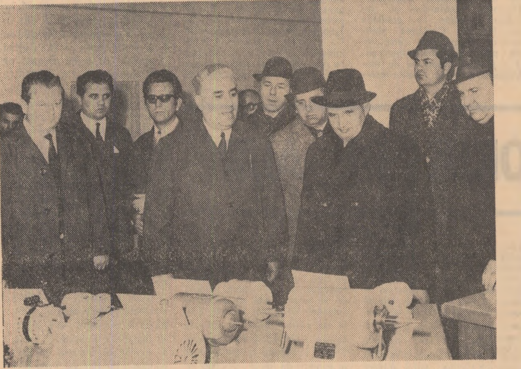
ELECTROTEHNICA — Indicațiile secretarului general al partidului constituie pentru colectivul întreprinderii un amplu program de activitate.

Reportaj realizat de: ION MĂRGINEANU, N. POPESCU BOGDĂNEȘTI, PAUL DIACONESCU, MIRCEA IONESCU, MIRCEA S. IONESCU, Foto: ANGHIE, PASAT, RADU CRISTESCU