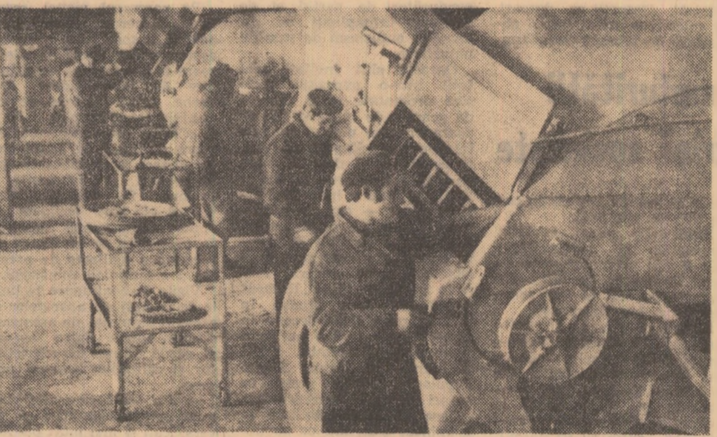
În atelierele stațiunilor de mecanizare se desfășoară din plin repararea utilajelor agricole.

Salut tineretul de azi! Viitorul omenirii depinde de gîndirea și de munca voastră stăruitoare. Eu vă doresc tuturor succes în eforturile pe care le faceți. Și nu uitați, ori de cîte ori vă este greu și aveți de trecut o piedică: „Imposibilul se află în visurile slăbănogilor”.