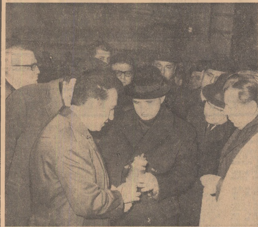
UZINA DE MAȘINI ELECTRICE — prima unitate a industriei noastre electrotehnice.

profil. Prima în șirul întreprinderilor înscrise în itinerariul vizitei de lucru de ieri. În fața uzinei, în întâmpinarea oaspeților se află o mulțime de oameni, membri ai colectivului întreprinderii, bucușorii de a primi în mijlocul lor pe tovarășul Nicolae Ceaușescu, pe ceilalți conducători de partid și de stat.