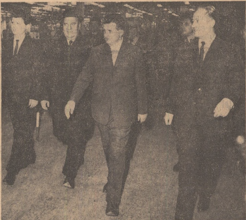
ELECTRONICA — locul unde se nasc imaginile și sunetele. Ca pretutindeni, oaspeții sînt întâmpinați cu căldură, cu dragoste