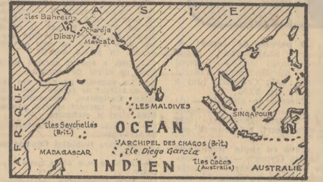
(Hartă reproducă după „TEMPS NOUVEAUX”)

În Grand Larousse sînt doar trei rînduri: „Diego Garcia, insula cea mai meridională a arhipelagului britanic Chagos (Oceaanul Indian), 600 locuitori, ulei de palmier”. Alta tot. Despre din insula minuscule a început, însă, să se vorbească în paginile ziarelor și chiar la importante reuniuni diplomatice. Neașteptata celebritate a peteului de pîmînt mîngîiat de Oceanul Indian nu se datorește nici uleiului de palmier și nici exotismului peisajului. Diego Garcia este pe punctul de a deveni o ba-