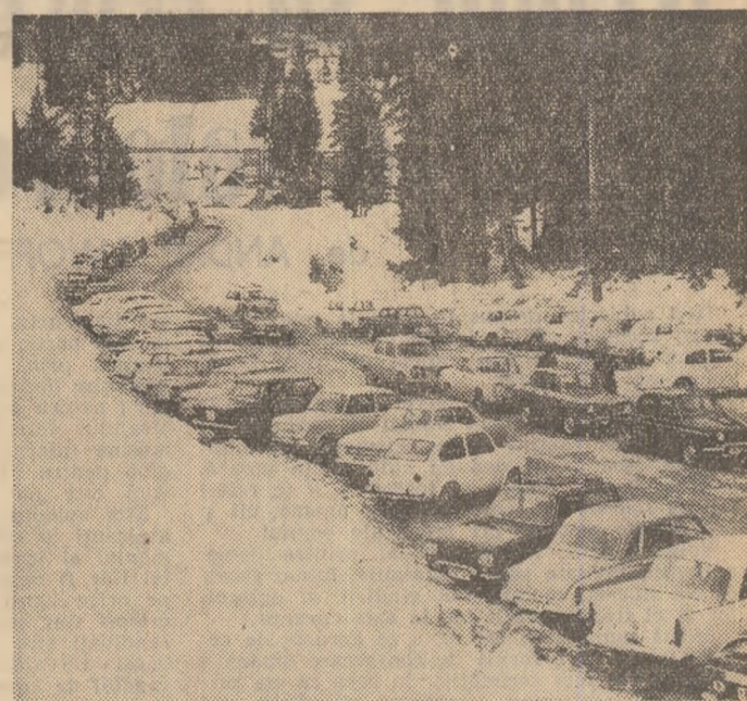
Imagine din Predeal

— De la început așa vrea să remarc faptul că ne-a preocupat în permanență diversificarea mijloacelor, îmbogățirea pirgurilor educative prin care am acționat pentru cultivarea la tineri a respectului față de muncă, de furtorii bunurilor materiale, pentru orientarea de masă a acestora către domeniile de cea mai mare importanță ale producției. Cînd am organizat, de pildă, concursul „Județul Timiș în plină dezvoltare” am pregătit tematicii și bibliografii diferențiate sub aspectul cunoștințelor pe care intenționăm să le transmitem diverselor categorii de tineri participanți. Și-au găsit locul în formularea întrebărilor acestui concurs problemele majore ale economiei județului, direcțiile de acțiune ale tinerilor și ale organizațiilor U.T.C. Capitalul propagandistic acumulat pe această cale a fost reintrudus în acțiune sub alte înfățișări proprii, capabile să răspundă unor împrejurări și cerințe particulare. V-am ruga să vă referiți mai pe larg asupra acestui aspect. — Pe datele asimilate prin concurs s-au succedat „albumele-stafetă” și „săptămîni ale porților deschise”, activități desfășurate în scopul orientării profesionale a tinerilor. Albumele-stafetă cuprîndînd adresele exacte ale tuturor școlilor profesionale și ale liceelor de specialitate din județ, precum și ale întreprinderilor unde vor fi angajați viitorii absolvenți. Ilustrate cu fotografii care redau aspecte din săli de clasă, laboratoare, locuri de desfășurare a practicii străbat în drumul lor spre Timișoara