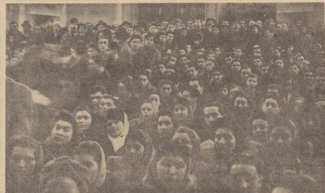
O fotografie document care ar putea fi intitulată „Tineretea părinților”: aspect din sala în care s-a ținut, cu 27 de ani în urmă, marea întrunire din București, în cadrul căreia tineretul și-a afirmat cu hotărâre voința de a lupta pentru instituirea unui guvern F.N.D.

vechi combatând al presei de tineret, de oasă din primul contingent al redacției noastre. Căci semnăm în acel prim număr, la pagina a patra dacă-mi aduc bine aminte, un reportaj amplu despre viața tineretului dintr-o fabrică. De la Malaxa. Se intitulă „Viața de trudă și mizerie a tinerilor” — reportaj de la o mare uzină din Capitală. Făcuse parte dintr-un serial: „Cum lucrează, ce mâncă și unde dorm tinerii muncitori de la Fabrica de Pânze Gătești”. „Viața de trudă a ucenicilor de la Metalurgica-Leul”, „Tinerii muncitori ai Văii Jiului”, „Printr-o tinerie de la U.C.B.”, „La Grivița Rostie” etc.