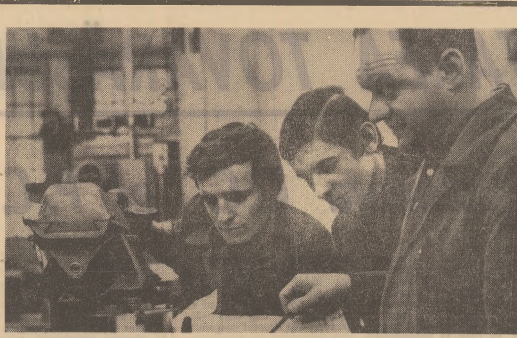
Dialogul deschis, prietenesc, cu cei care au o bogată experiență, este modalitatea prin care elevii școlii profesionale pot pătrunde mai adînc în tainele meseriei alose.