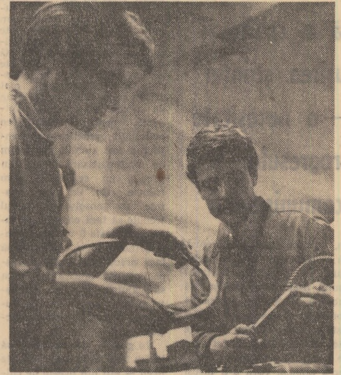
În sectorul de mecanizare a agriculturii județului Dolj și în cel de irigații lucrează aproape zece mii de tineri, adică aproape două treimi din totalul salariaților. Cei mai mulți s-au pregătit prin școlile profesionale, alții s-au calificat la locul de muncă, și într-un caz, și în celălalt, organizațiile U.T.C. manifestîndu-se ca importanți factori în educarea și mobilizarea acestora.