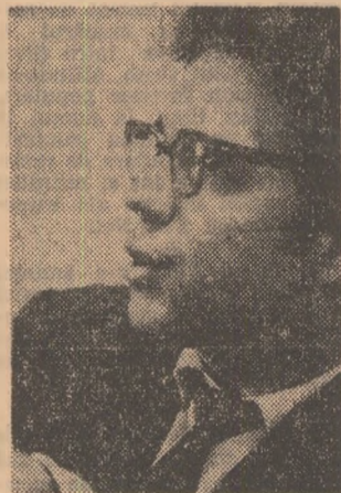
FLORIN GEORGESCU : „Un numitor comun...”

A face în așa fel, ca, în afara oricăror constrîngereri — simpli, ca între oameni ai aceluiași pămînt, deprinși să-și rostuiască din ce în ce mai bine munca și viața — sufletul și mintea tuturor să cuprindă firesc dăruirea și înțelegerea, curajul neamului și sentimentul nobil al adevărului și al dreptății — iată sensul uman al democrației noastre socialiste, iată deci conținutul încercării a trudei, mobile din perioada ce ne așteaptă.