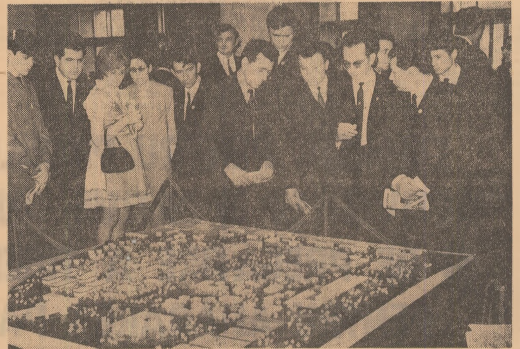
Într-o pauză a Congresului U.T.C.

au răspuns la numeroase întrebări ce le-au fost adresate. La loc de frunte pe agenda acestor întâlniri au stat diferite aspecte privitoare la ridicarea pregătirii profesionale a tineretului, la creșterea celor mai bune condiții pentru integrarea lor în producție la nivelul sarcinilor sportive ale noului cincinal. Redăm pe scurt conținutul discuțiilor.