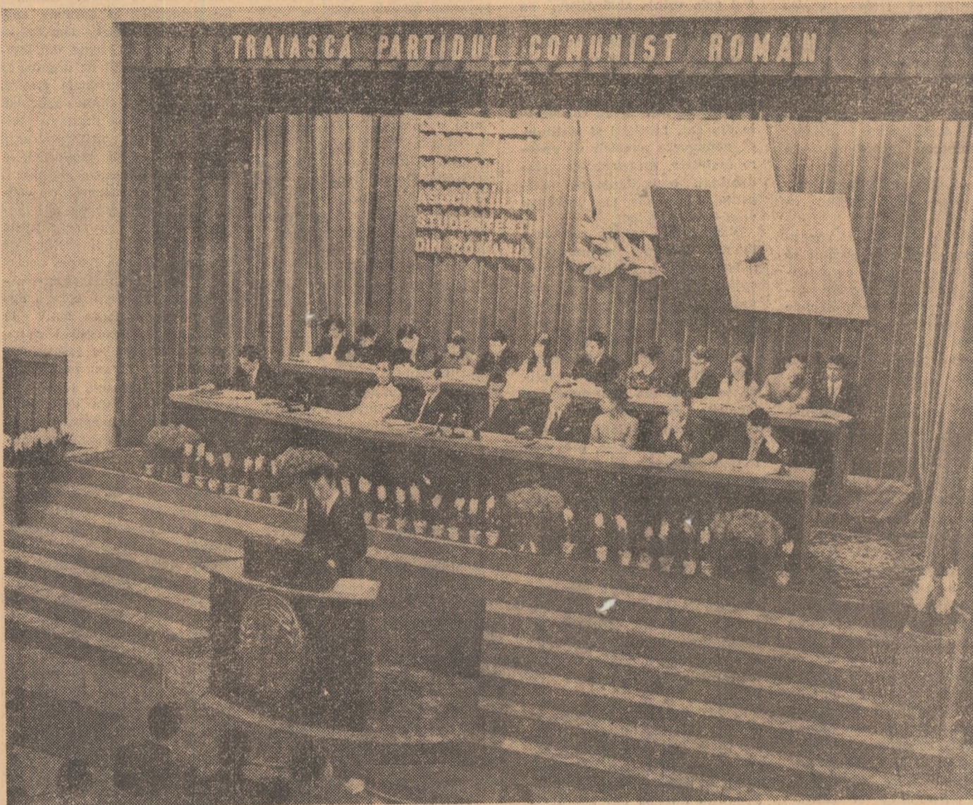
In timpul prezentării raportului Consiliului Uniunii Asociațiilor Studențești la cea de a VIII-a Conferință a U.A.S.R.