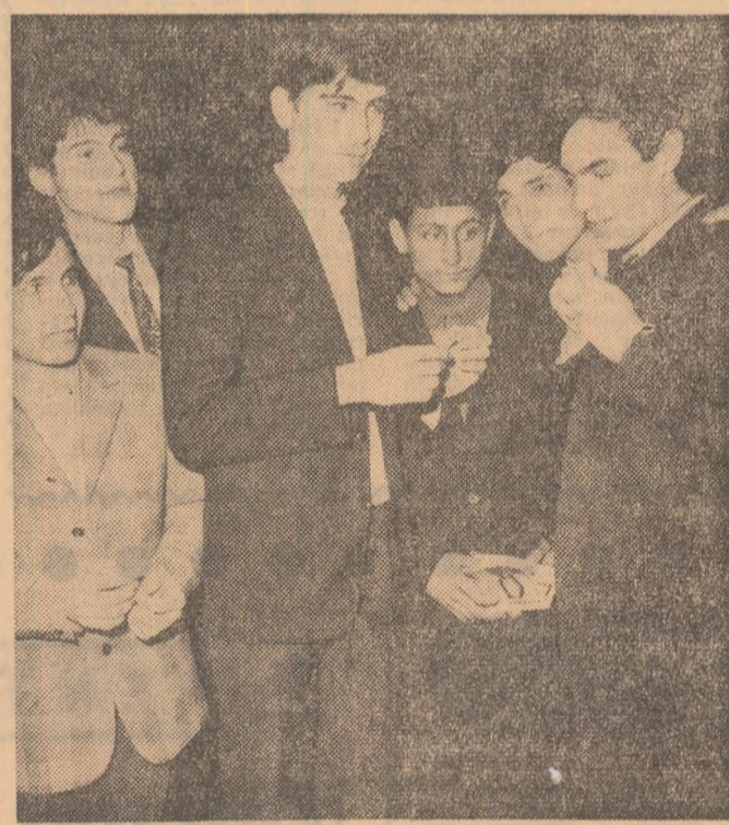
Schimb de insigne la Clubul T-4