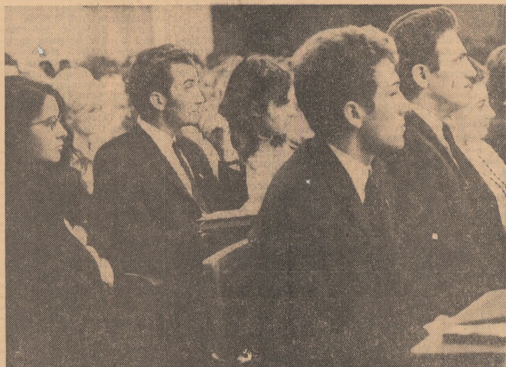
În timpul lucrărilor Conferinței U.A.S.R.

Dincolo de particularitățile vieții studențești discutate în contextul permanențelor căutări de așezare a învățămîntului de toate gradele pe bazele științifice presupuse de continua evoluție a societății, dincolo de modul specific, și cu atît mai important, de formare profesională și socială, dincolo, în sfîrșit, de specificitatea unor dănești sau singularitatea unor opinii, rămîne ca dominantă, și se cuvine a fi subliniată, realitatea apartenenței tineretului nostru studențesc la marea familie a tineretului țării, rămîne deci ca dominantă și semnificativă prin consecințele ei umane și politice comunitatea de idealuri și nădejdi a întregii generații, comunitatea de încredere în ziua de mine a țării și a tuturor.