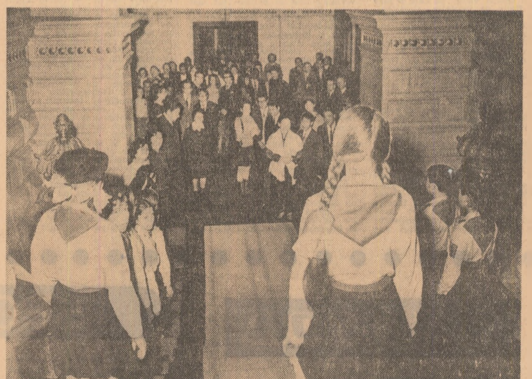
La Palatul pionierilor