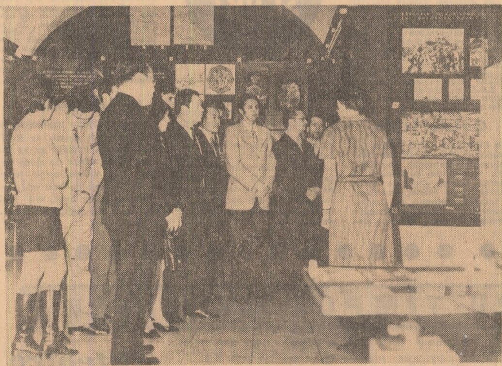
La Muzeul de istorie a Partidului Comunist, a mișcării revoluționare și democratice din România