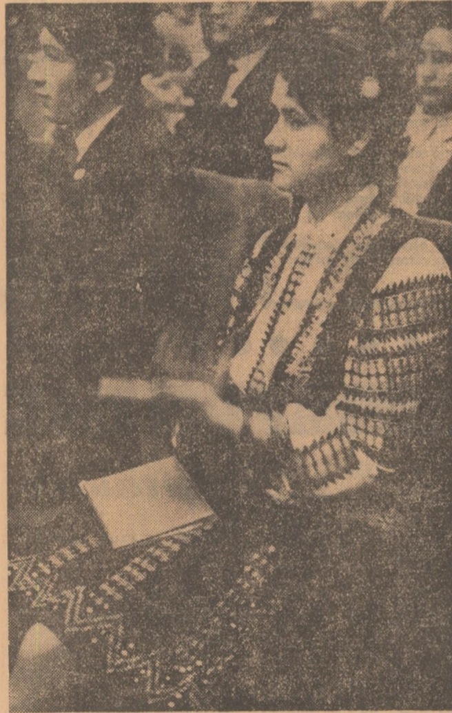
Un instantaneu din Sala Congresului, unul din momentele care vor trăi mult timp în memorie.