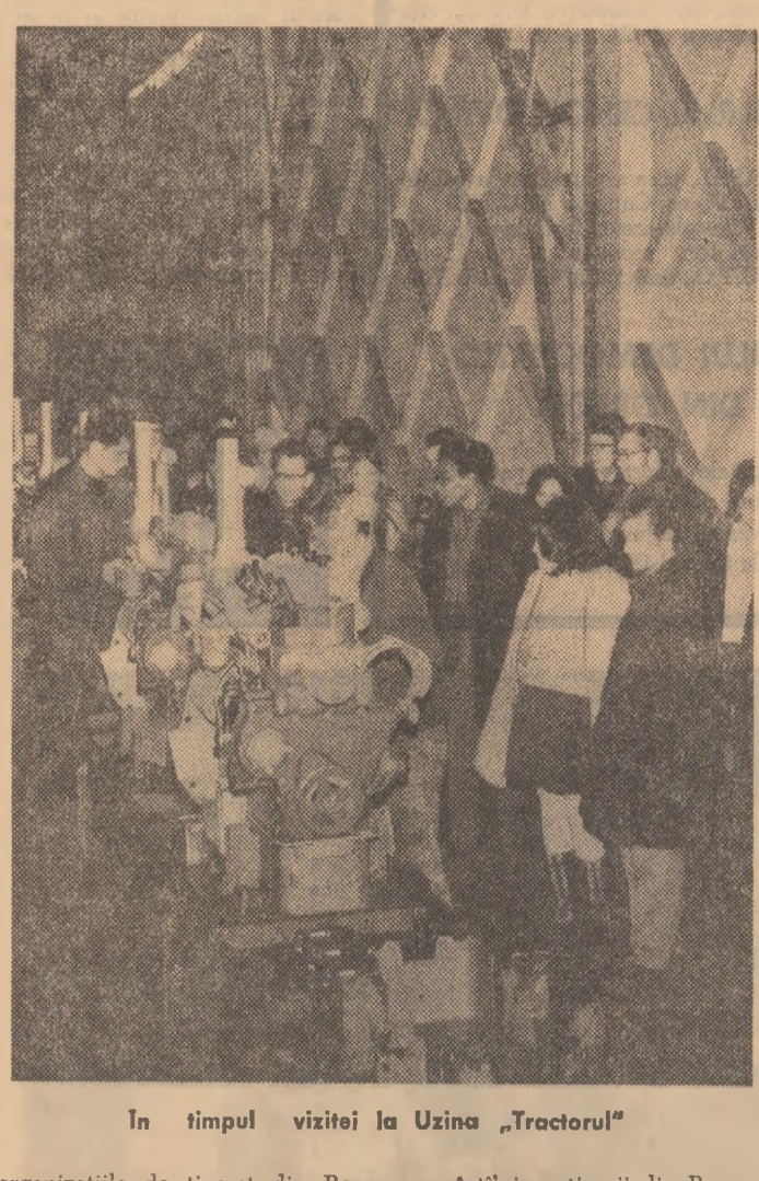
În timpul vizitei la Uzina „Tractorul”

organizațiile de tineret din România și Algeria. Vorbitorul a trecut în revistă preocupările organizației sale angajată în efortul întregului popor algerian pentru dezvoltarea țării. Reprezentantul J.F.L.N. a subliniat, apoi, importanța pe care o are sprijinirea luptei poporului palestinian pentru drepturile sale legitime, denunțînd manevrele imperialiste în Orientul Apropiat. Vorbitorul a exprimat simpatii de mulțumire pentru sprijinul pe care poporul și tineretul român îl acordă luptei popoarelor arabe împotriva imperialismului, colonialismului și neocolonialismului, pentru pace și progres, ca și satisfacția pentru posibilitatea ce i-a fost oferită de