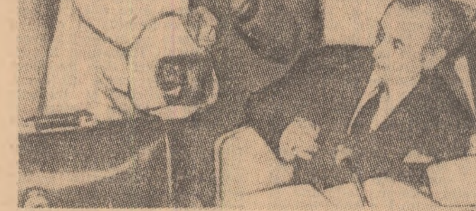
BRUXELLES — Miniștrii agriculturii din țările Pieței Comune au fost socoți cînd în timpul unei sesiuni, pe usă și-au făcut apariția trei vaci ai căror proprietari, fermieri belgieni, încercuiau în acest fel să protesteze împotriva prețurilor comunitare.