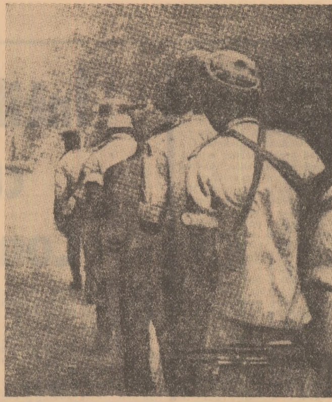
Unitate a forțelor populare din Guineea (Bissau)

Ambasadorul Ignatieff a prezentat apoi punctul de vedere al guvernului canadian potrivit căruia problema de perspectivă imediată aflată în fața Comitetului este interzicerea experiențelor nucleare subterane.