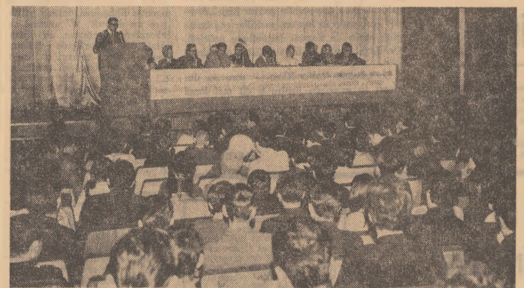
Aspect de la mîntingul desfășurat la Uzina „Tractorul”

— Cum apreciați prezența tinerilor la discuții, ce trebuie înțepins în rîndul acestora, pentru a-i atrage în dezbaterile problemelor care se pun în fața colectivului lor?