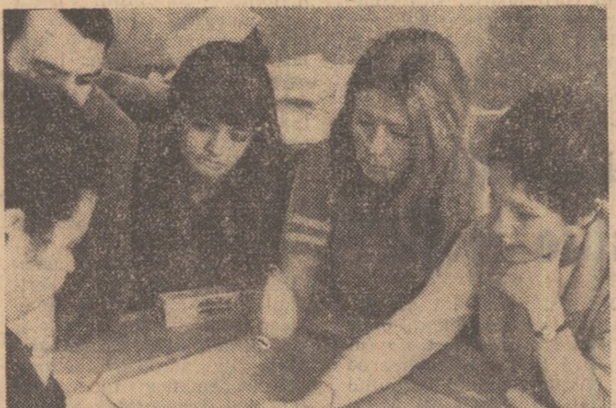
În atelierul de proiectări al Institutului de arhitectură Ion Mincu — București