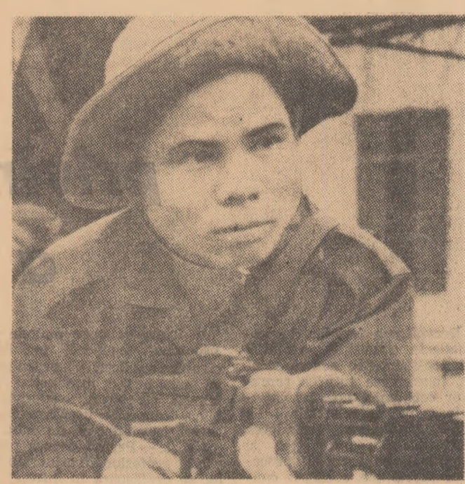
O fotografie venită din îndepărtatul Vietnam.

lucie a conflictului nu poate fi obținută prin acțiuni militare, ci printr-o reglementare politică justă, conform drepturilor naționale inalienabile ale poporului vietnamez împotriva imperialismului pentru reglementarea problemei vietnameze, expuse deosebit de clar în documentele Republicii Democratice Vietnam și ale Guvernului Revoluționar Provizoriu al Republicii Vietnamului de Sud, prevăd, drept condiție esențială retragerea condiționată și totală a trupelor americane și ale celorlalte state care participă la agresiunea din Indochina.