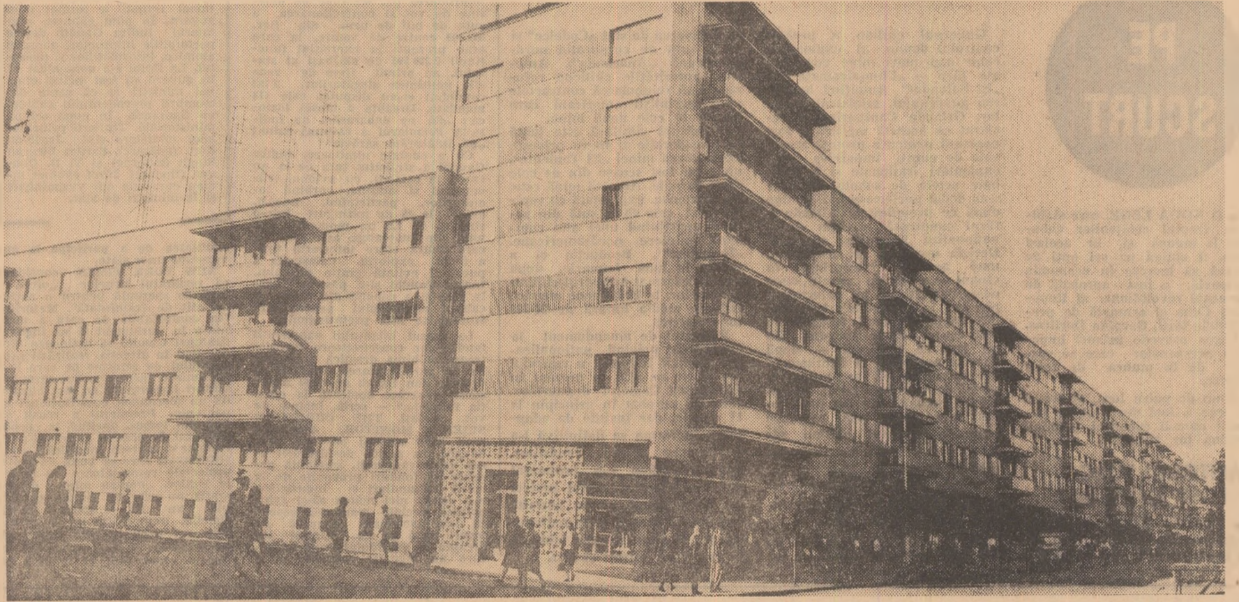
Arad. Blocuri noi.

● 3 933 DE APARTAMENTE, ● 7 200 DE LOCUINȚE au fost construite în aceeași perioadă din fondurile populației. ● 5 100 LOCUINȚE s-au construit la sate