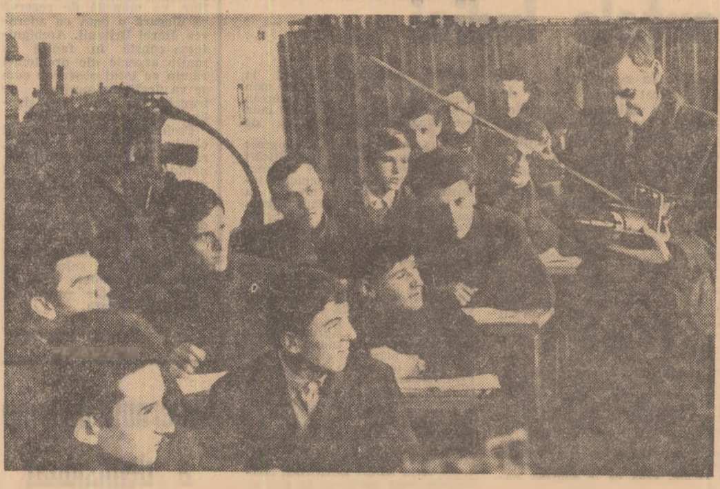
Școala profesională agricolă din Sintana, județul Arad

ÎNVĂȚĂMÎNTUL PROFESIONAL ● În 12 școli profesionale, sînt pregătiți muncitori în aproape 50 meserii. Pe băncile școlilor se află acum 5 686 elevi; 2 227 au absolvit numai în vara anului trecut. ● Cinci licee de specialitate, înființate în cincinal, pregătesc în 8 meserii 1 500 elevi.