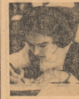
Reportierul nostru a surprins o imagine de concurs la Liceul „Mihai Viteazul” din Capitală, în timpul lucrării de literatură română.

• OLIMPIADA: Finaliștii concursului de limba și literatura română au intrat primii în competiția pe țară. Reprezentanții tuturor județelor, câteva sute — cei care au întrunit punctajul maxim în fața anterioară — își dispută cunoștințele și capacitatea de valoare. La sfârșitul celor trei zile de concurs și de program comun îi vom cunoaște pe premiații și, firește, ca în fiecare an, le vom acorda locul de cinste.