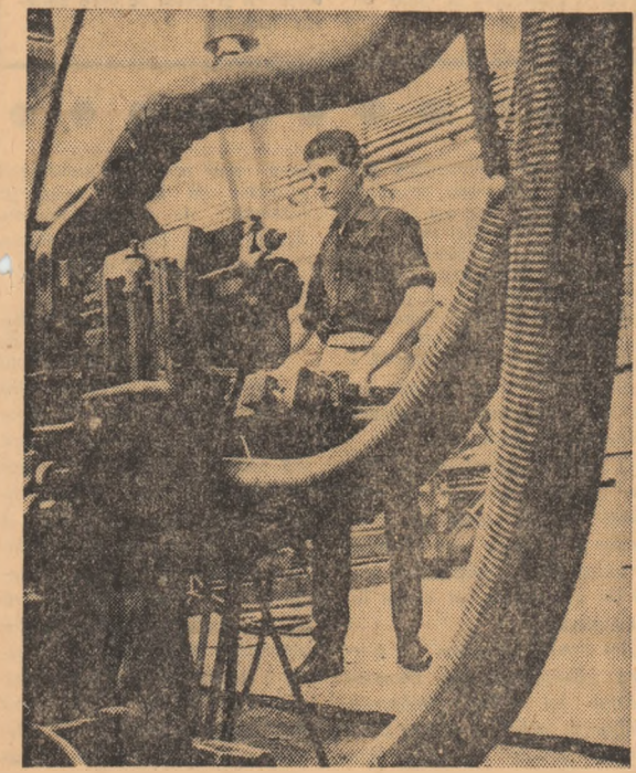
Fabrica de mobilă Sighetul Mar maijei — secția de prelucrare