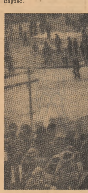
În Irlanda de nord, incidentele dintre populația și forțele de ordine continuă. După un calm relativ, sennalată la sfârșitul săptămânii trecute, luni și marți, la Londonderry și în cartierul Ballymacrae din Belfast, tensiunea a crescut din nou. În fotografie: soldați britanici la Londonderry.

● LUND CUVINTUL la o reuniune a reprezentanților lucrătorilor din sectorul agricol de stat, președintele Consiliului Revoluției al Algeriei, Houari Boumediene, a făcut o serie de precizări în legătură cu noul cod petrolier adoptat recent. El a arătat că hidrocarburile algeriene vor fi exploatate în beneficiul și sub controlul exclusiv al statului. Orice societate străină care operează sau dorește să-și desfășoare activitatea în Algeria, în domeniul prospecției și exploatarei petrolului, va trebui, în primul rând, să acționeze în asociație cu Societatea națională de hidrocarburi, „Sonatrach”, care urma să dețină cel puțin 51 la sută din pachetul de acțiuni. În Algeria, a declarat în închierie Houari Boumediene, „regimul concesiunilor pentru străini a fost lichidat”.