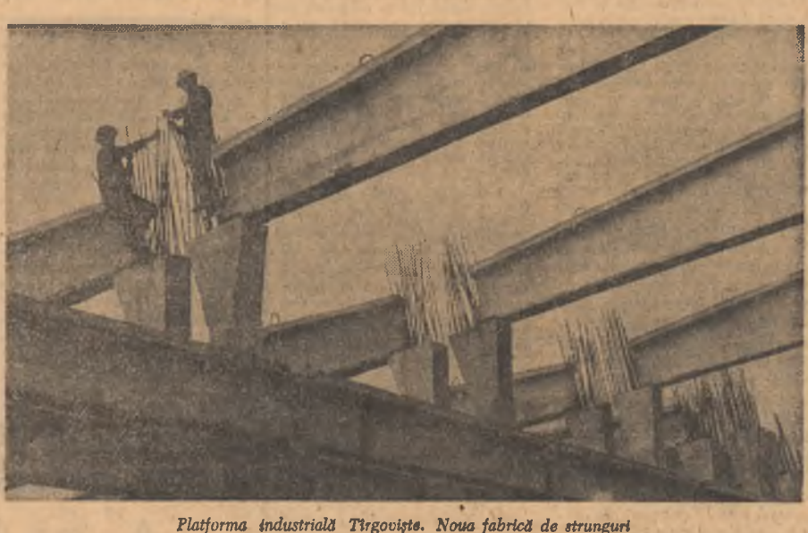
Platforma industrială Tirgoviște. Noua fabrică de strunguri