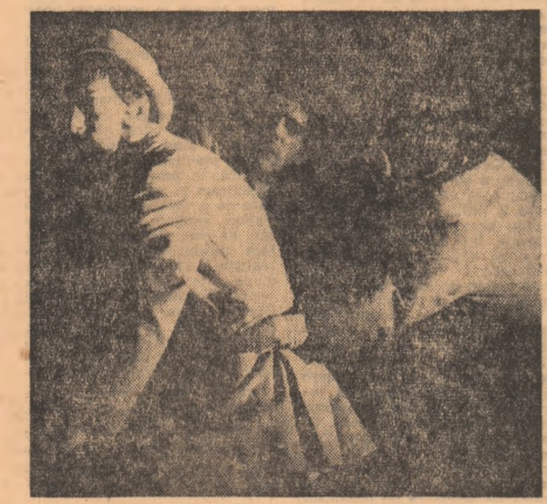
Scenă din spectacolul cu piesa Ecto-Bar.

În prelungirea excelentei expoziții de la Dalles, închisă recent, o altă expoziție de scenografie — una ad-hoc — își etalează în aceste zile valorile. O expoziție la scara 1/1. Și itinerantă, purtîndu-și prîvitorii de la „Comedia“ la „Studio“, de la „Mio“ la „Nottara“, de-aici în Schitu Măgureanu... Tema acestei „expoziții“: SPAȚII DE JOC DEDICATE DRAMATURGIEI ORIGINALE. Modalitățile de abordare: variate, demonstrînd, pe scara unei gradualități valorice foarte strîmte, o bogăție de intenții și stiluri, de direcții întru eficiență artistică și de ipostaze ale talentelor școlii românești de scenografie.