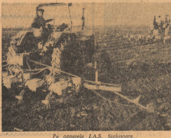
Pe ogarele I.A.S. Sighișoara