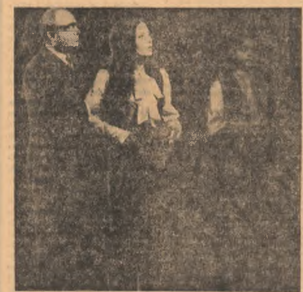
Timp și adevăr — un spectacol jucat în zilele dramaturgiei românești.

(Urmare din pag. 1) universitară să încetăm o tradiție. De mai mult vreme stu-denții institutelor noastre de artă își doresc o competiție a lor, pe profilul pregătirii de specialitate, în cadrul căreia să-și poată pre-zenta creațiile din anii studenției. U.A.S.R., scootînd valoroasă a-ceaștă inițiativă, a receptat-o și, începînd cu acest an unicestar se instituie Festivalul Național al Studenților Institutului de Artă — cu caracter de concurs, desfășurîndu-se din doi în doi ani.