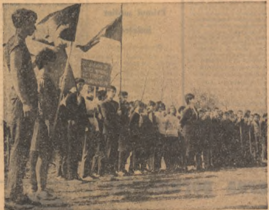
La Brănești, Ilfov