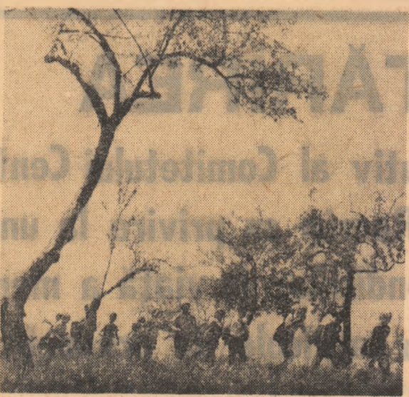
In sir indian la tarba verde.