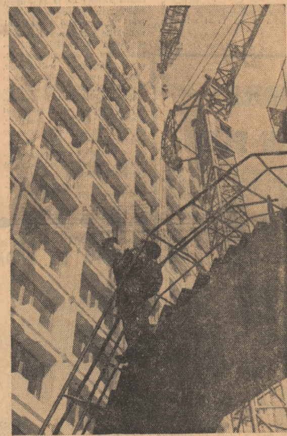
Timișoara. Un nou hotel își profilează silueta.

OCTAVIAN MILEA (Continuare în pag. a II-a)