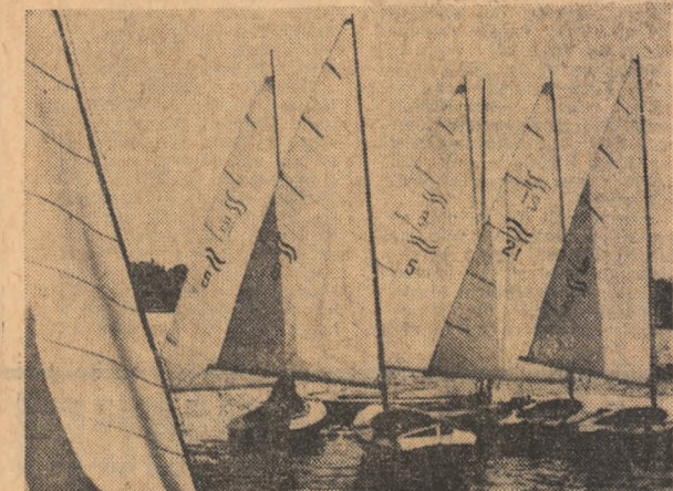
O invitație pentru timpul liber.