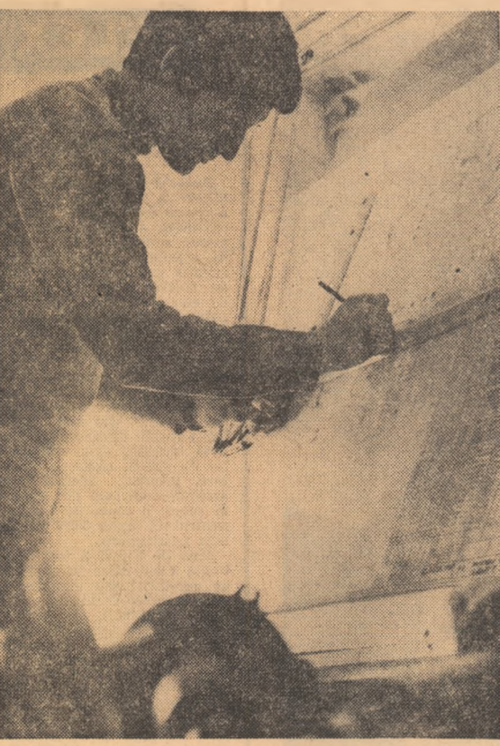
Din această aplecare continuă asupra planșetei țesătoare cunșturile avîntate spre înălțimi.