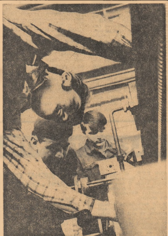
Instantaneu cotidian la Uzina de strunguri din Arad: se efectuează verificarea unui nou tip de strung.