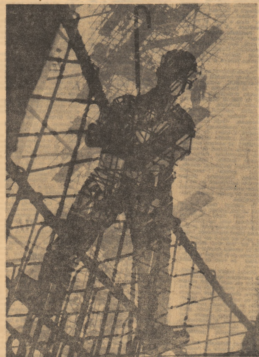
Fotografie primită în cadrul concursului ziarului nostru „PATRIA IN ANII SOCIALISMULUI”

Între inițialele acte revoluționare prin care se legitima viabilitatea orînduirii socialiste și cronică ultimelor zile de laborios efort constructiv s-a interpus o distanță pentru măsurarea căreia unitatea de timp se vedește a fi lipsită de semnificație, dacă nu chiar cu totul caducă. Vom măsura, astfel, distanța așezată cu o unitate de măsură mai adecvată și anume raportînd-o la restructurările majore care au afectat mentalitatea tuturor generațiilor de oameni ai muncii din patria noastră sedimentînd, cu deosebire în finier, trîpături de caracter noi, orizonturi noi, aspirații conforme timpului pe care îl trăim. A fi constructor al socialismului, semnifică, în ultimă instanță, a fi posesorul unei vocații și o vocație nu se poate împlini decît în măsura în care datele inferioare ale omului decurg din realitatea care îl încorporează și, totodată, aplicîndu-se asupra realității, îi imprimă o evoluție în consens cu mersul obiectiv al istoriei. Acest mecanism — a cărui dialectică nu este dedusă abstract, ci este impusă de concretul cel mai ardent al timpului nostru — guvernează procesul de făurire a unui om nou, eliberat de toate tarele unei orînduirii care încetășa elanurile creatoare. În același timp, omul nu este numai o simplă creație, ci și o entitate spirituală a cărei activitate diurnă își proiectează consecințele în viitor. În măsura în care este creație a unui timp, omul nu se legitimează și ca creator în sensul de înfrîngător al timpului care îl zămisleşte.