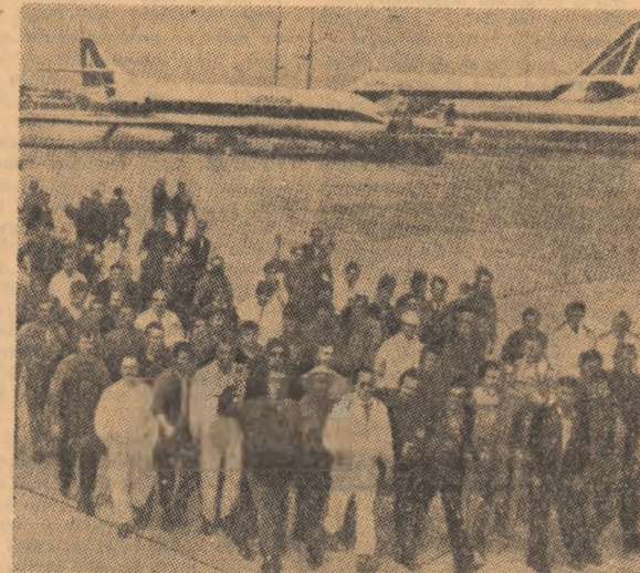
ITALIA. — Mișcarea greviștă a cuprins numeroase domenii de activitate, printre care și transporturile aeriene. În imagine, greviștii de la aeroportul internațional Fiumicino.

● IN NOUL oraș Havirov din R. S. Cehoslovacă a avut loc o zi a culturii românești consacrată aniversării semicenteniului Partidului Comunist Român. Cu acest prilej, s-a deschis o expoziție de fotografii o expoziție de filme documentare. De asemenea, a avut loc o adunare la care au participat reprezentanții ai organelor locale de partid și de stat, conducători de întreprinderi din bazinul carbonifer Ostrava-Karvina, locuitori ai orașului și membri ai ambasadei României la Praga.