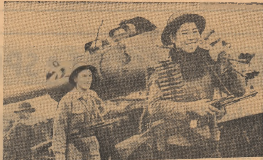
VIETNAMUL DE SUD. — O subunitate a patrioților întorcându-se spre bază, după un atac încheiat cu succes.

Secretarul de stat american a fost primit, de asemenea, la Vatican de papa Paul al VI-lea.