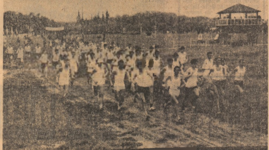
Ieri, la Craiova

U.M. Timișoara-C.S.M. Sibiu 3-0, Gaz metan Medias-C.F.R. Arad 1-0, Electroputer Craiova-Crișul Oradea 0-1, Olimpia Satu Mare-Politehnica Timișoara 1-1, Vagonul Arad-Corvinii Hunedoara 0-0, Olimpia Oradea-Mineral Anina 1-0, Mineral Hala Mare-Gloria Bistrița 4-0.