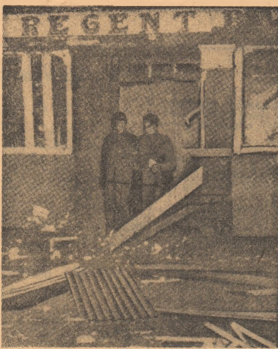
IRLANDA DE NORD. — Au avut loc noi atentate mai ales la Belfast, unde, în cursul ultimilor zile mai multe bombe au explodat în diverse locuri publice

CAIRO. — Agenția M.E.N. anunță că Mohamed Fawzi, ministrul apărării, Samy Sharaf, ministrul de stat pentru problemele prezidențiale, Hilmy El Said, ministrul energiei electrice, Saad Zayed, ministrul locuințelor și utilității publice, și Mohammed Fayek, ministrul informațiilor, și-au prezentat joi demisia președintelui Republicii Arabe Unite, Anwar Sadat. Agenția M.E.N. anunță că Abdel Mohsen Aboul Nour, secretar general al Uniunii Socialiste Arabe, Muhammad Labib Shukeir, președintele Adunării Naționale a R.A.U., membru în Comitetul Executiv Suprem al U.S.A., și Dia-el-Din Daud, membru în Comitetul Executiv Suprem al U.S.A., și-au prezentat joi demisiile din funcțiile Comitetului Executiv Suprem al Uniunii Socialiste Arabe.