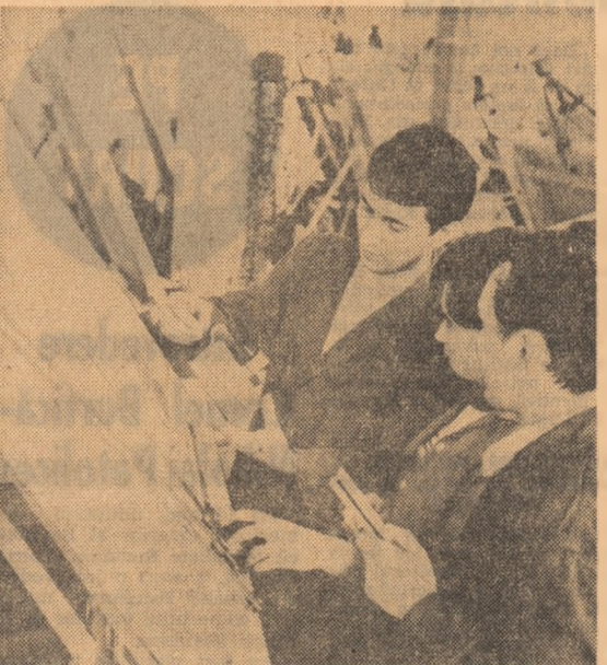
În atelierul de proiectare al Uzinei „Balanţa” Sibiu. Tinerii ingineri discută proiectul unui nou cîntar de uz cosmic.