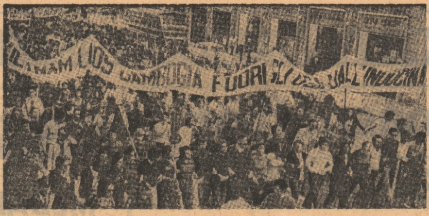
Puternice manifestații a tineretului din Roma împotriva politicii S.U.A. în Indochina. La manifestații au participat membri ai Federației Tineretului Comunist Italian, ai Federației Tineretului Socialist și ai Tineretului P.S.I.U.P.