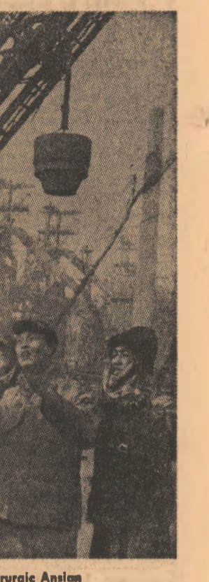
La combinatul siderurgic Anshan

În vremea acestuia, pulsul vital al marului oraș vibrează interior — în fabrici și uzine, pe șantiere — producția cu noscînd ritmurii nemăslinute altcînd... În timpul unui popas, îl rog pe șofer — tovarășul Cen — să-mi citească, din numărul proaspăt al lui „Jenminjibao”, ultimele vești. Cen vorbește și românească... vorbînd, așa cum a învățat-o în cei 20 de ani de serviciu. „Nene! Imi spune el uite ce scrie ziarul”: că la Heilunkiang au mai intrat în funcțiune 12 furnale mijlocii și că se lucrează acolo deodată la 2 000 de fabrici mici. Pe urmă!