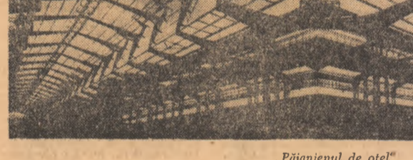
„Păianjenul de oțel”

AL. BALGRADEAN (Continuare în pag. a V-a)