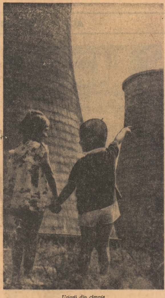
„Uriași din cîmpie”

Zidurile pe care le vedeți crescînd în această fotografie vor fi finalizate imediat după terminarea lor. Totuși constructorii se străduiesc să le execute cât mai repede și mai bine, pentru că ei sînt antrenanți într-un concurs de pricepere și îndeminare. Sînt elevi-zidari ai școlilor profesionale patronate de consiliile populare, ajunși în finala primei lor competiții republicane de acest fel, desfășurate zilele trecute în Capitală.