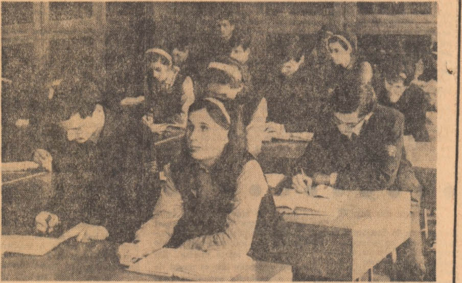
Noul laborator de fizică din cadrul Liceului nr. 2 Satu Mare.

(Urmare din pag. 1) Il se adresează cu usurință (de această categorie, complice în afara sistemului nostru de învățămînt, este necesar să se ocupe, în mod serios, organcile fiscale sau, după caz, cele de cercetare penală); b) fie fosti profesori, actualmente pensionari; c) fie chiar profesori activi, ceea ce se pare cel puțin o neobișnuită în cazul statului etic de pedagog. Pentru că, oricine este chemat să se ocupe de procesul instructiv-educativ al elevilor, nu o poate face decît — ca elevii organizat al sistemului nostru de învățămînt — între meditații și profesor nu poate fi pus nemul egalității. Acceptarea unei interferențe n-ar însemna decît acceptarea unui non sens. Școala, și numai școala, trebuie să se ocupe de elevii săi.