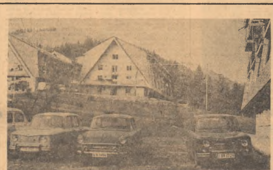
La Voineasa, pe Lotru