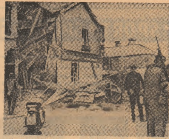
IRLANDA DE NORD. — După cum s-a anunțat, recent au avut loc mai multe explozii la Belfast soldate cu numeroase pagube

partid și de stat, a depus o coroană de flori la monumentul comemorativ — un bloc masiv de piatră albă, purtînd inscripția: „Glorie veșnică ostașilor români căzuți pentru Eliberarea Republicii Cehoslovacă”. Monumentul era strălucit de o gardă de onoare. De-a lungul traseului prin cimitir se aflau înșiruite detașamente de pionieri. Cu această ocazie, delegația Partidului Comunist Român a depus o coroană de flori la monumentul eroilor sovietici, căzuți pentru cauza comună a înfrîngerii și lichidării barbariei fasciste, pentru telul nobil al libertății și fericirii popoarelor.