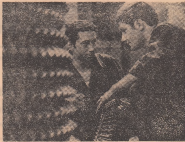
Uzina de utilaje și piese de schimb pentru materiale de construcții — secția mecanică grea.