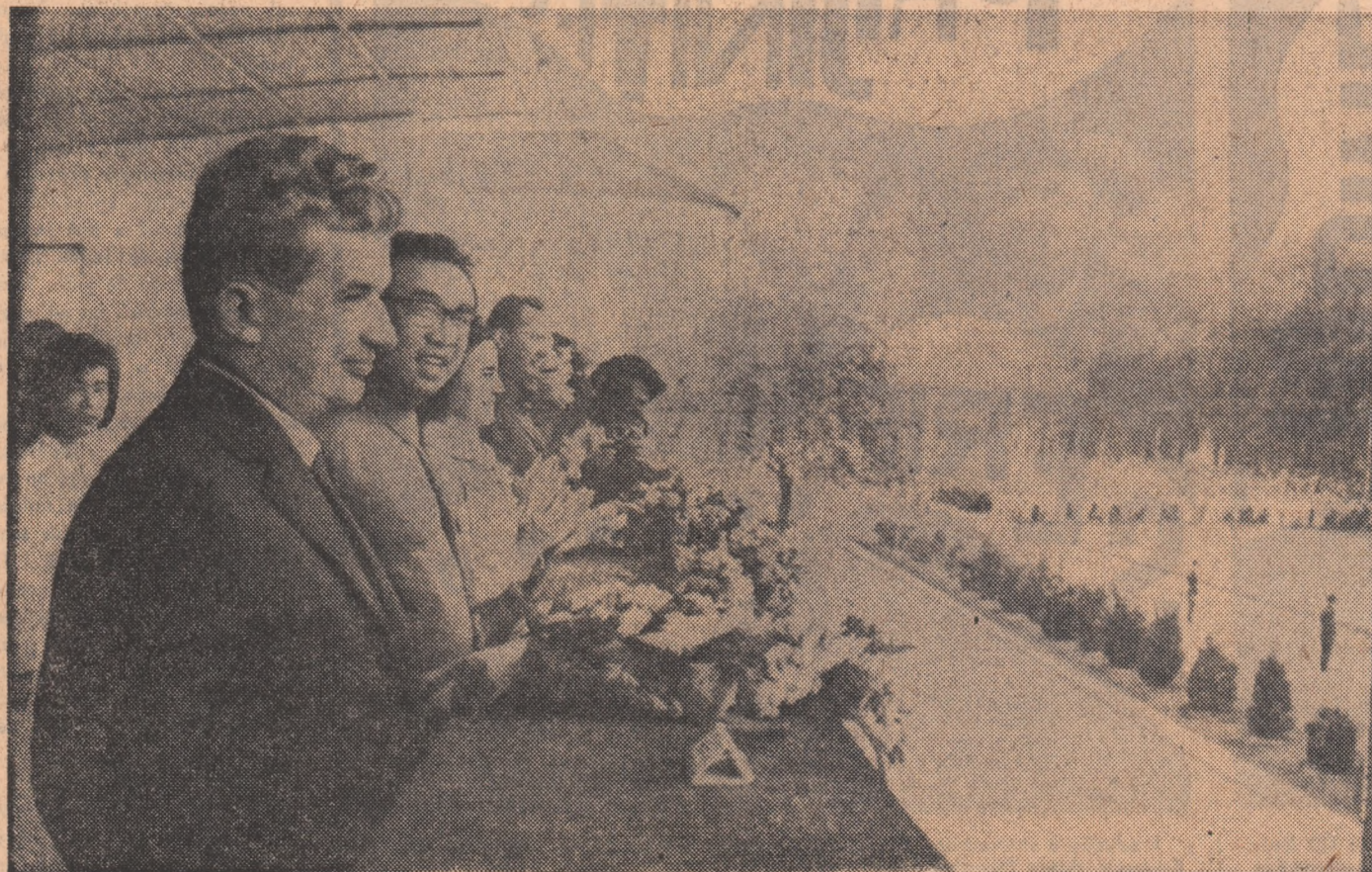
Aspect din timpul mitingului care a avut loc la Hamhîn