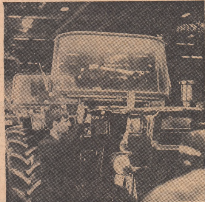
Ultima verificare înainte de plecarea spre ogoarele patriei

IUSTIN MORARU (Continuare în pag. a II a)