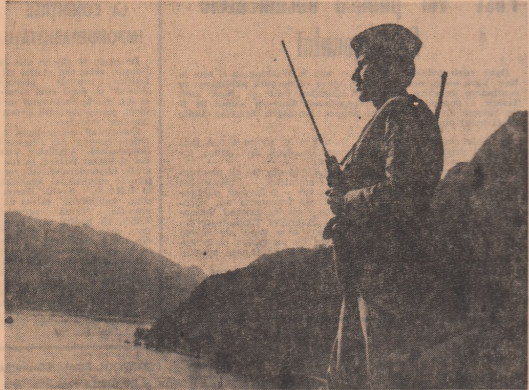
De veghe la hotarul pământului strămoșesc