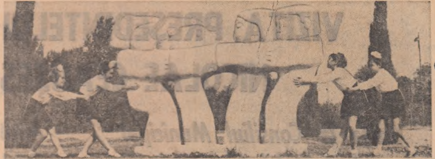
„Care pe care”