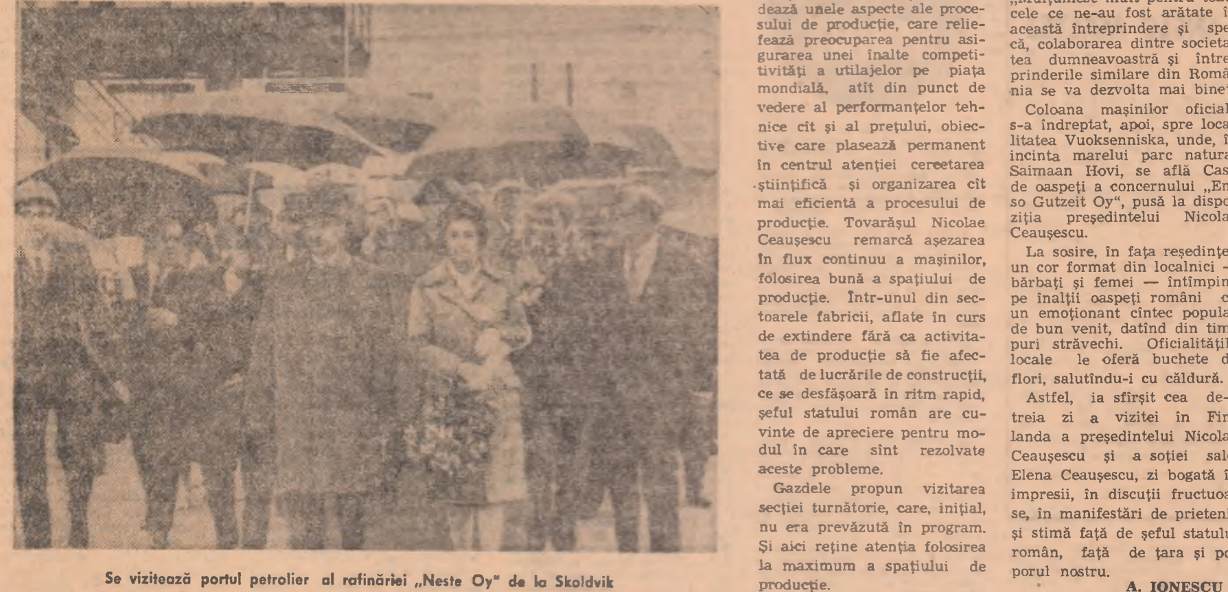
Se vizitează portul petrolier al rafinării „Neste Oy“ de la Skoldvik

Președintele Statelor Unite ale Americii, Richard Nixon, a transmis, celei de-a VIII-a Conferințe Mondiale de Capitală, găzduită de Capitala țării noastre, un mesaj de salut, prin care urează succes lucrărilor conferinței.