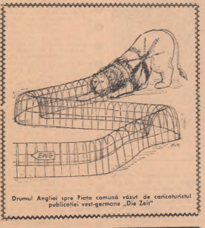
Drumul Angiei spre Piața comună văzut de caricaturistul publicității vest-germane „Die Zeit”