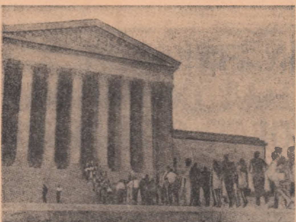
S.U.A. — „Coadă” în foto clădirii Curții Supreme din Washington: cetățeni exprimându-și acordul cu dezvoltările ziarelor „New York Times” și „Washington Post”

În continuare, vorbitorul a arătat că părțile vietnameze vor reglementa împreună problema forțelor armate vietnameze din Vietnamul de sud, în spiritul înțelegerii naționale, al egalității și respectului reciproc, fără intervenție străină. În ceea ce privește reunificarea Vietnamului, Nguyen Thi Binh a declarat că ea se va realiza „pas cu pas, prin mijloace pașnice, pe baza discuțiilor și acordurilor dintre cele două zone”. Conducătoarea delegației G.R.P. a subliniat că Vietnamul de sud va promova o politică externă de pace și neutralitate, va stabili relații cu toate țările, indiferent de regimul lor politic sau social, în conformitate cu principiile coexistenței pașnice. În încheiere, conducătoarea delegației Guvernului Revoluționar al Republicii Vietnamului de Sud a spus că acord asupra modalităților de respectare a garanțiilor internaționale privind acordurile vor fi realizate.