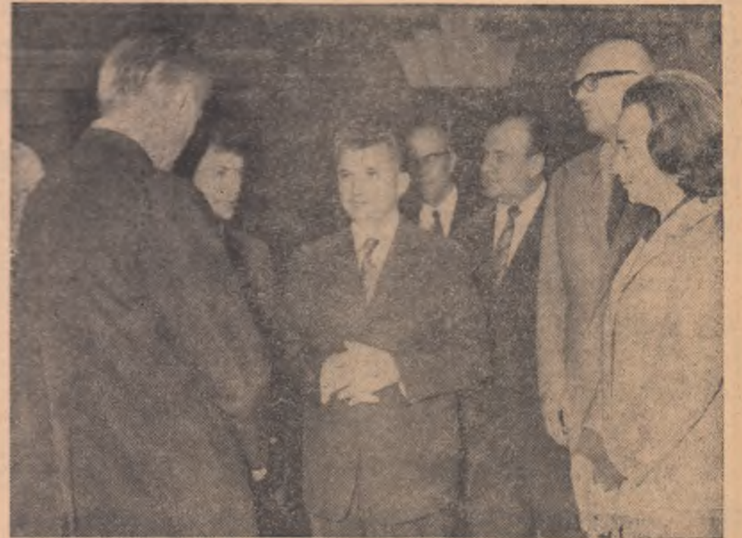
Convorbire prietenească la Șantierul naval de la Helsinki

După convorbirile, contactele politice și întâlnirile cu locuitorii orașului Helsinki care au avut loc în primele două zile în capitala Finlandei, programul vizitei președintelui Consiliului de Stat, Nicolae Ceaușescu, a continuat, joi, cu o substanțială activitate de cunoaștere a preocupărilor și realizărilor țării gazdă pe tărîm economic, social, științific și cultural.