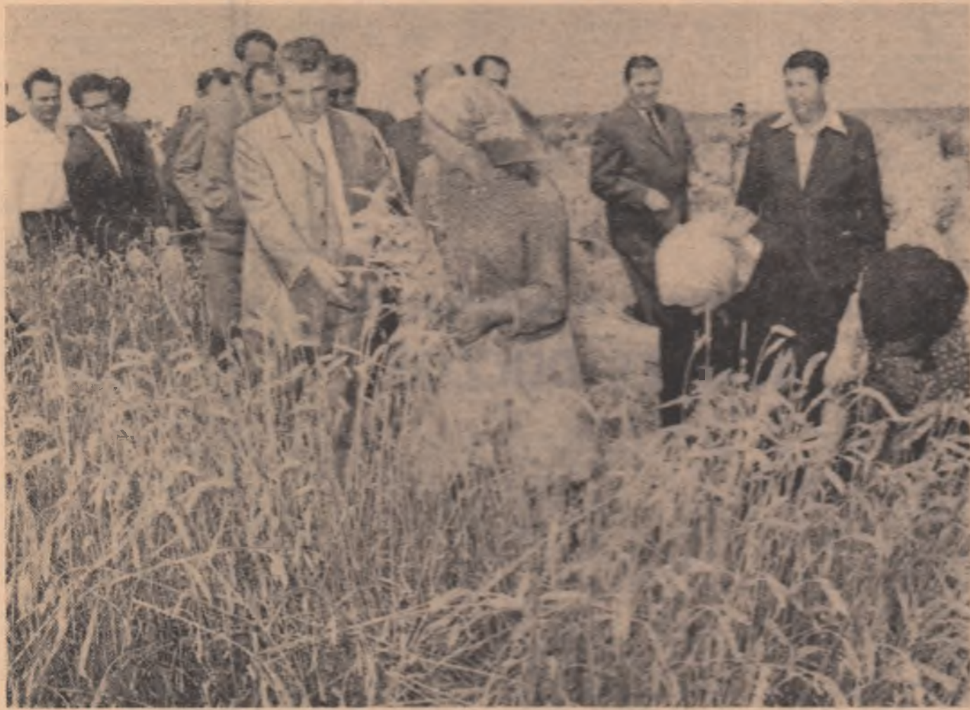
La lanurile cooperativelor agricole din comuna Ilfovea

Pe cîmp domnește o activitate febrilă. Alături de combine care seceră și treieră, de mașini care string și balotează paie, se efectuează arături. Pămîntul are suficiente rezerve