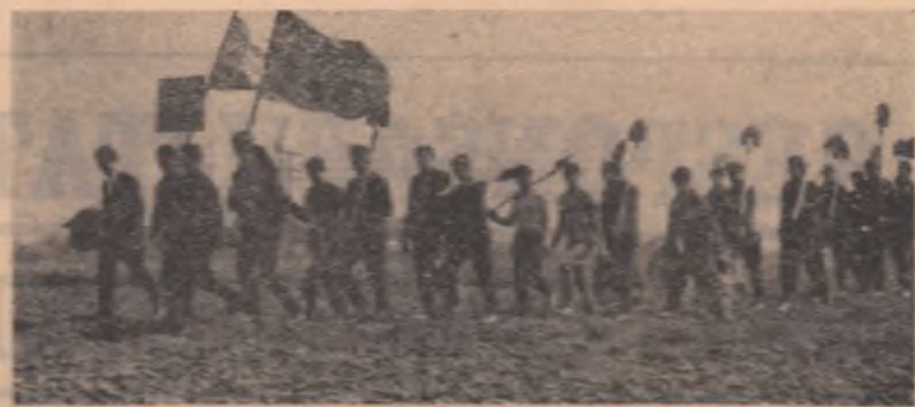
DECLARA ÎN NUMELE TOVARĂȘILOR LOR DE MUNCĂ 15 TINERI CONSTRUCTORI DE PE ȘANTIERUL NAȚIONAL AL TINERETULUI DE LA SOMES