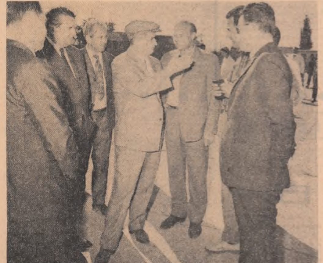
Discuție cu specialiștii I.A.S. Ograda