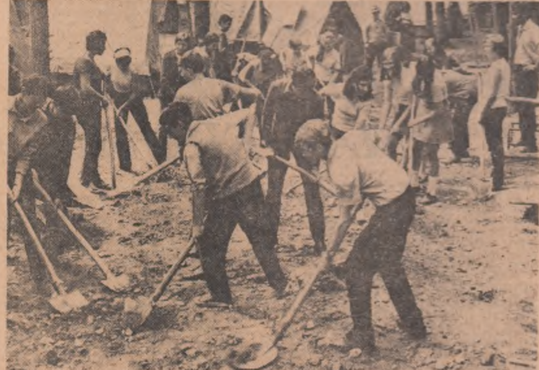
Electri liceului Nr. 2 din Sibiu în tabăra de muncă patriotică de la cîmpingul tineretului din „Dumbrava Sibiului”