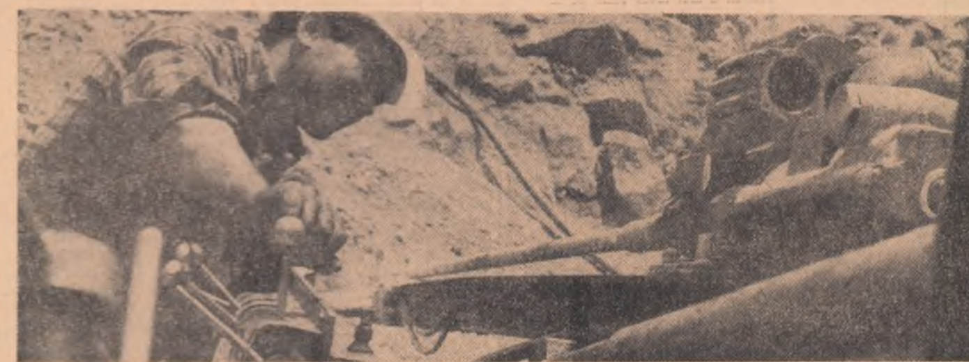
„Pe foreze se lucrează cu viteze ridicate”.

— Ascult această avalanșă de întâmplări relatate cu prospețime de către cei doi ingineri. Sandu și Boieru. Veneau oameni încercați în aie șantierului. Au rămas cei care își iubesc meseria și vor să facă meserie.