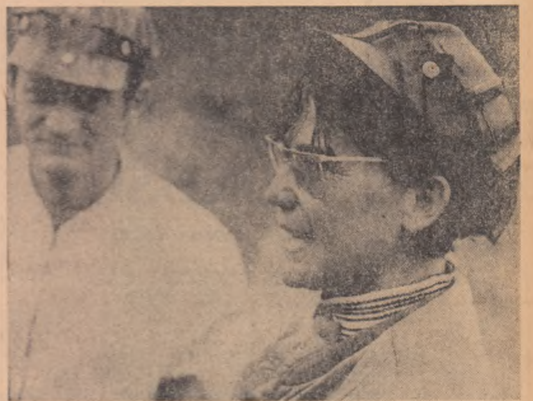
„M-am angajat la Someș, făcând nevasta acasă, la Cluj. N-am rezistat. Am venit înapoi...”